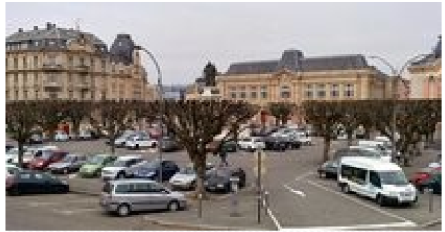
Le stationnement gratuit à Belfort