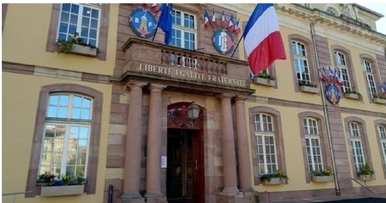
Fermeture des accueils du public de la Ville de Belfort et du Grand Belfort