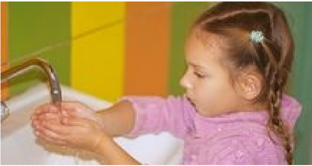
Coronavirus : la Ville se mobilise pour le personnel soignant 7J/7