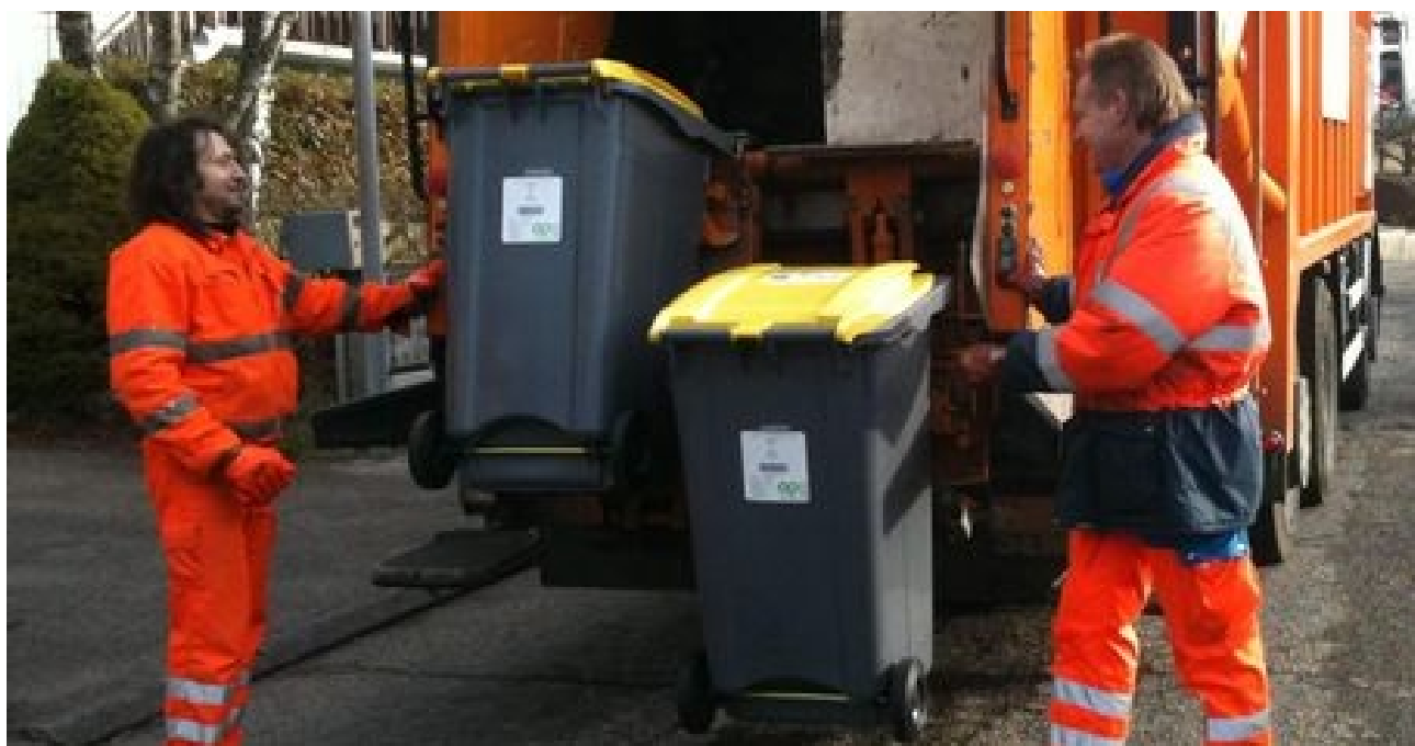
Les équipes du service déchets restent mobilisés