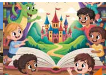
Cric, crac, croc, mes histoires à croquer