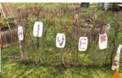
Célébration de l'hiver au jardin art nouveau