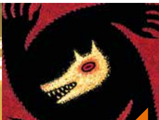
Le loup-garou de Thiercelieux