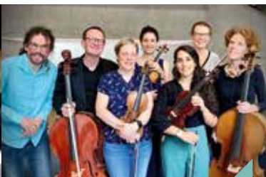
Au gré des cordes, de Rossini à aujourd'hui