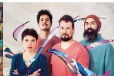
Jazz à la pépi : Chocho cannelle