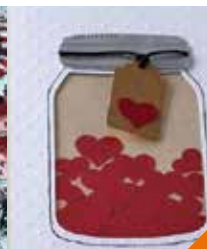
Cartes de saint-valentin