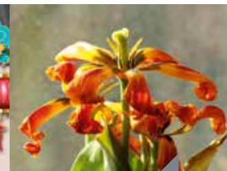
La ménopause sans tabou