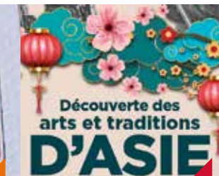
Arts et traditions d'Asie