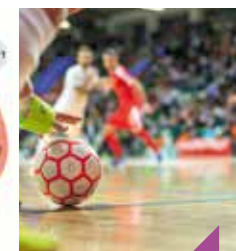
Tournoi de futsal