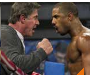
Pop-corn quiz spécial sports