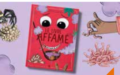
Atelier illustration avec Laurence Clément