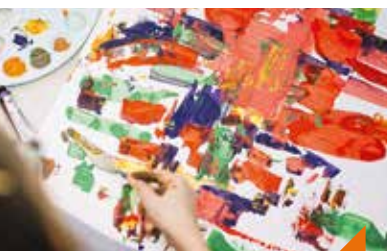
Atelier : peindre sa ville ou sa campagne