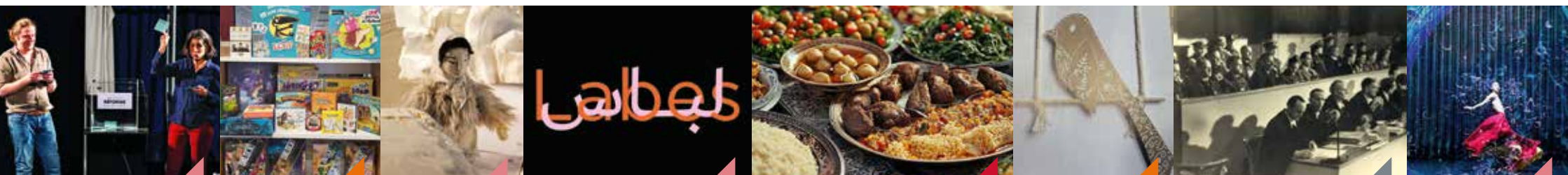
Démocratie mon amour