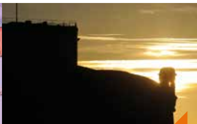
Visite guidée inédite : mémoire et conflits...