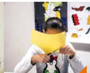
Atelier 7-12 ans mon petit bestiaire