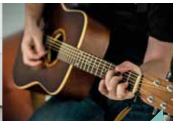
Auditions de guitare du conservatoire