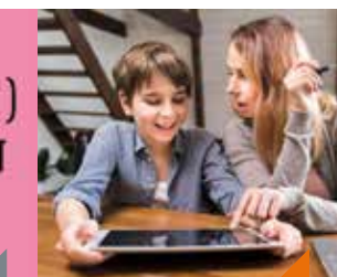
Atelier jeux sur tablette