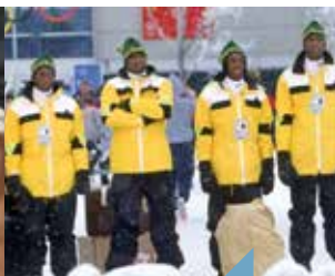
Projection : Rasta rockett