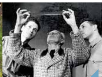
Nuremberg : des images pour l'histoire