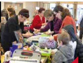
54e bourse toutes collections