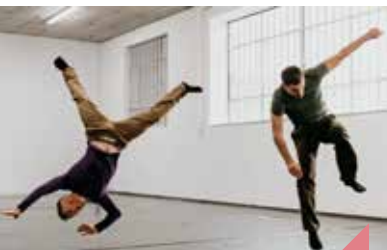
Spectacle Horizon danse