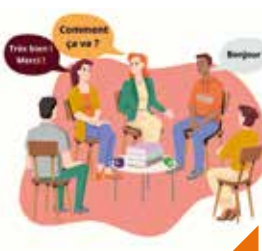
Parlons français ensemble !