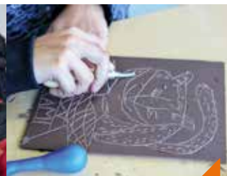
Atelier découverte linogravure