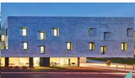
Nuit des conservatoires