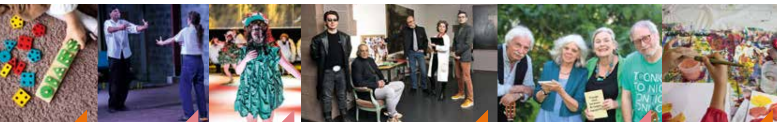
Jeux de société Openvia George de Molière Enquête ado : Le fantôme de lady Van Allmer Platero et moi Atelier 4 mains ça dé-coiffe