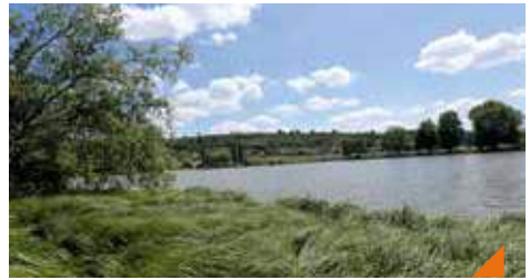
Zen à l'étang des Forges