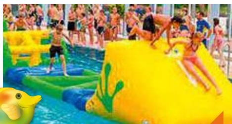
Jeux aquatiques sur structures gonflables