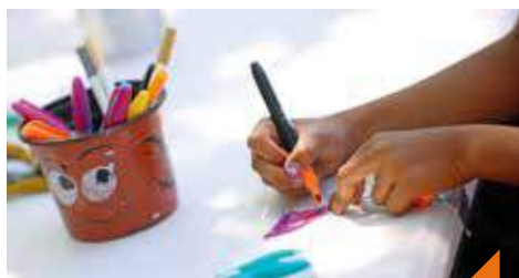
Création de cartes postales graphiques