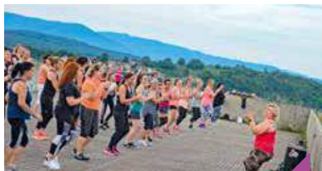
Zumba à la Citadelle