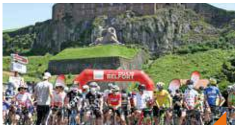
Tour du Territoire de Belfort