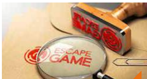
P'tites méninges : escape game