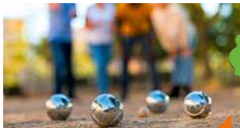
Initiation à la pétanque