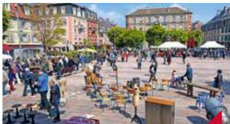
Marché aux puces