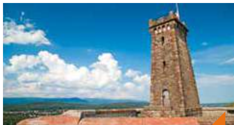
Spectacle itinérant : il faut sauver la Miotte !