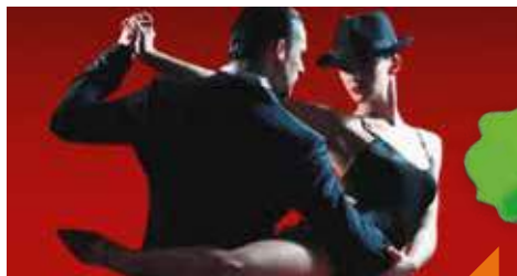
Initiation au tango argentin