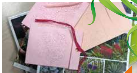
Pochette à graines