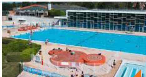
Baptêmes de plongée