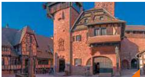
Visite du Château du Haut-Koenigsbourg