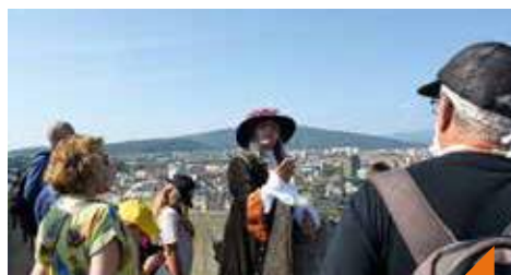
Spectacle itinérant: un architecte au service du Roi-Soleil