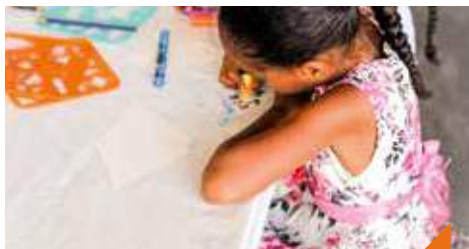
Fabriquer un bracelet de coquillage avec la princesse Ariel