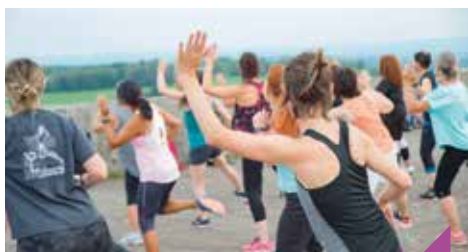
Zumba à la Citadelle