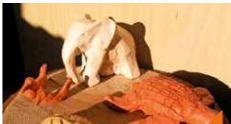
Modelage d'animaux couchés en argile