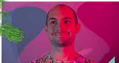
Malibu et Flupke