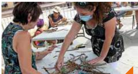
Atelier végétal : bouquet champêtre