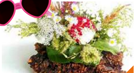
Atelier végétal : chemin de table