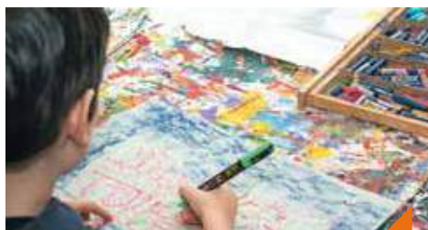
Atelier 4 mains : la petite fabrique