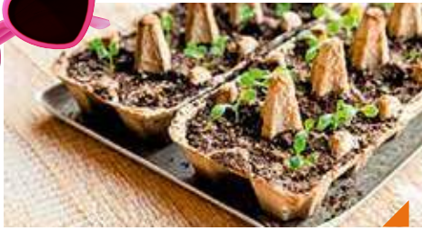
Jeu grandeur nature : petit jardin fleuri écologique