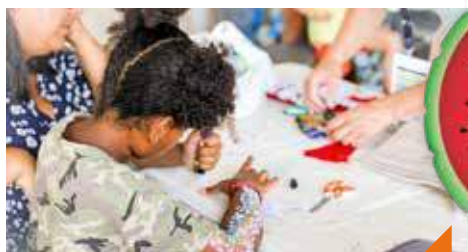
Création d'une carte en 3D pop-up