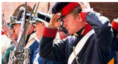
Journées d'histoires vivantes