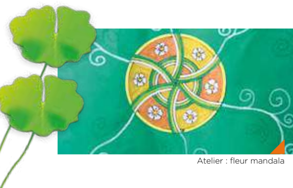
Atelier : fleur mandala