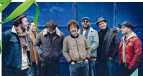
Same Player Shoot Again