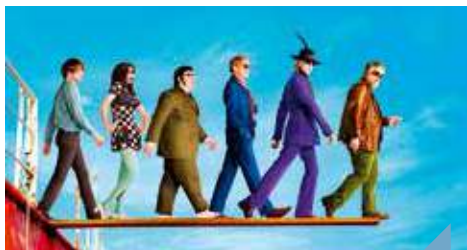
Good Morning England