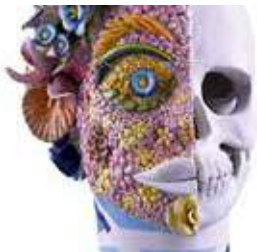
Visite commentée : « Les 5 vies de Livia De Poli »