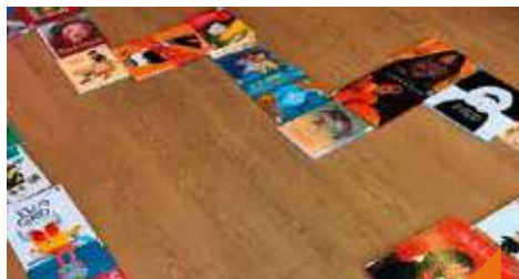
Jeu grandeur nature