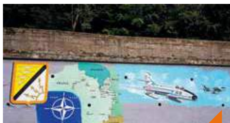
Visite du Fort de l'OTAN