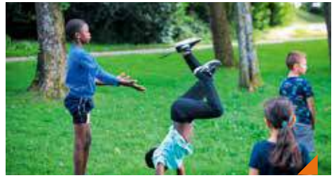
Initiation au hip-hop