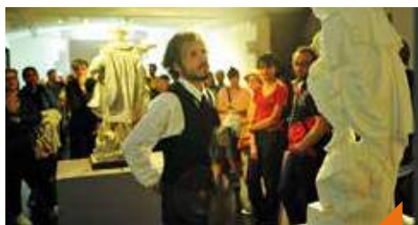
Atelier 4 mains : enquête au musée