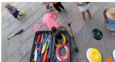
Initiation au cirque