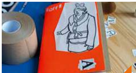
Fabrication d'un carnet récup'