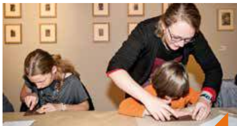
Atelier 4 mains : l'habit ne fait pas le moine