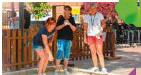
Initiation à la pétanque