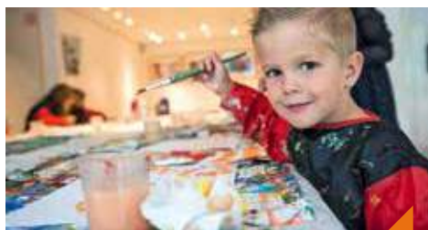
Atelier 4-6 ans : drôles d'objets !