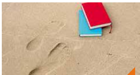
Les orteils dans le sable