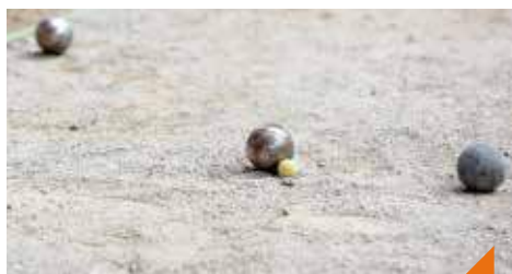
Initiation à la pétanque