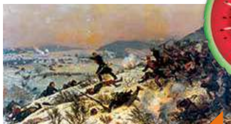
Spectacle itinérant inédit : en état de siège !