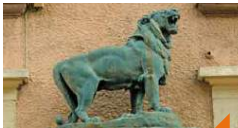
Jeu de piste : chasse aux lions contée