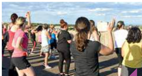
Zumba à la Citadelle