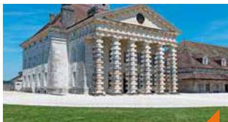
Visite de la saline Royale