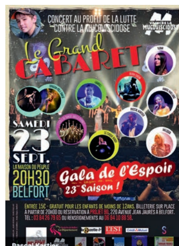
Rendez-vous le 23 septembre pour le Gala de l'Espoir.