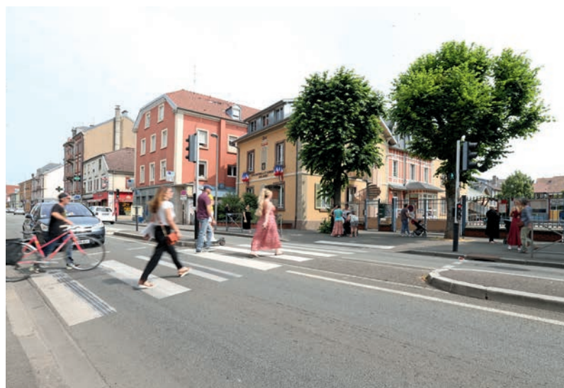
L'îlot central et les feux tricolores devant l'école élémentaire Jean-Jaurès

Les abords des écoles sont des points de rencontre où se croisent voitures, bus, deux-roues et piétons, notamment aux heures de pointe. Leur sécurisation est donc essentielle.