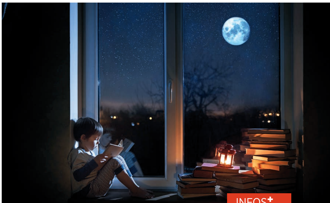
La nuit s'invite pour l'édition 2023 du Mois du livre

Des ateliers seront de plus proposés dans les bibliothèques municipales. Le Mois du livre, ce sont aussi des rencontres :