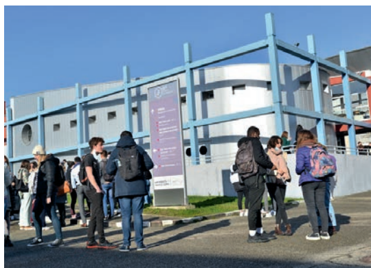
L'IUT du Nord Franche-Comté à Belfort

Avec plusieurs établissements et 1 790 étudiants à Belfort, l'université de Franche-Comté (UFC) est l'une des actrices majeures de l'enseignement supérieur dans notre ville. Elle fête en 2023 ses... 600 ans d'existence, avec un programme d'événements mettant en lumière sa riche histoire et l'excellence de ses formations.