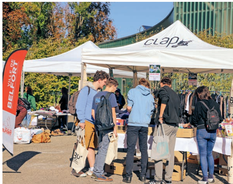
Troc et informations lors de la journée « Bienvenue aux étudiants »

Jeudi 28 septembre, de 12 h à 17 h, au Phare, rue Paul-Kœpfler Concert à partir de 21 h à la Citadelle, char Martin