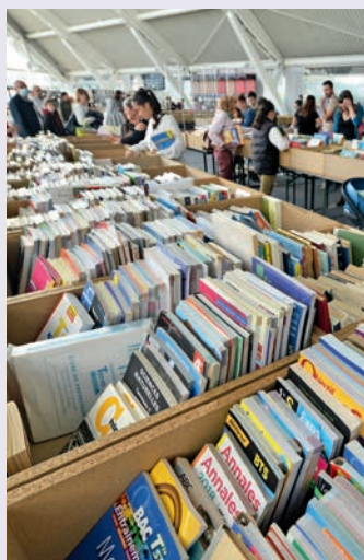
La Foire aux livres, un événement incontournable à l'Atria