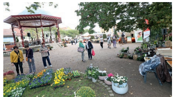
Un marché aux couleurs de l'automne au square Carlos-Bohn (Roseraie)

Qu'allez-vous planter dans votre jardin cet automne ? Vous trouverez la réponse au marché aux plantes « Couleurs d'automne ». Les producteurs locaux vous proposeront fleurs, légumes, arbustes, une belle palette de végétaux pour orner votre jardin ou garnir votre assiette, mais aussi de l'artisanat et de la gastronomie.