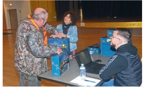
Banquet des aînés à l'Atria ou colis gourmand à savourer chez soi, vous avez le choix !

Cette année à nouveau, vous pourrez opter pour la solution qui vous convient le mieux : profiter de la convivialité du banquet ou savourer les gourmandises que vous réserve le colis.