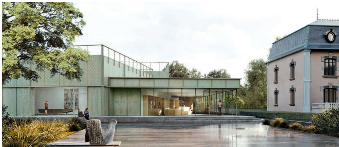
Le projet d'extension du musée d'Art moderne-donation Maurice-Jardot (image Scaranello Architectures ©adagp, Paris, 2023)

Les premiers coups de pelle ont marqué le début du chantier du futur pôle muséal de Belfort pendant l'été. Le projet d'extension du musée d'Art moderne - donation Maurice-Jardot commence donc à prendre corps !