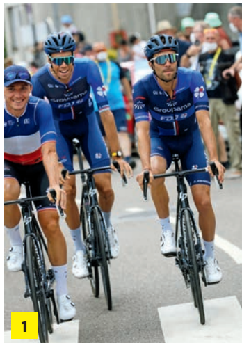
1 Thibaut Pinot, le coureur local très attendu par le public belfortain

Belfort a vécu, le 22 juillet dernier, une magnifique fête populaire en accueillant le départ de l'avant-dernière étape de la Grande Boucle. 20 000 personnes se pressaient le long du parcours pour applaudir les coureurs prêts à affronter un programme pimenté de cols et de sommets. Le Lion, la Citadelle ou encore la vieille ville ont eux aussi brillé sous l'œil des caméras !