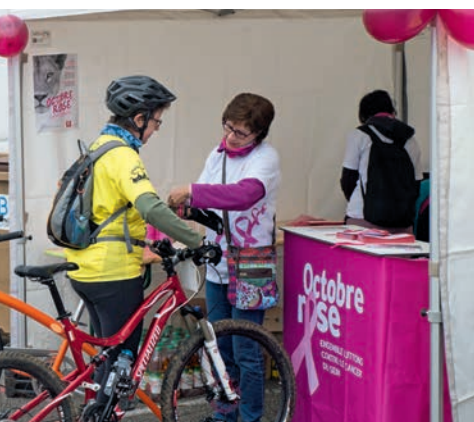
Un stand pour Octobre rose lors de la Transterritoire

L'association la Maison des Femmes s'associe à la campagne en organisant à la salle des fêtes un thé dansant. Les recettes seront intégralement reversées à la Ligue contre le cancer.