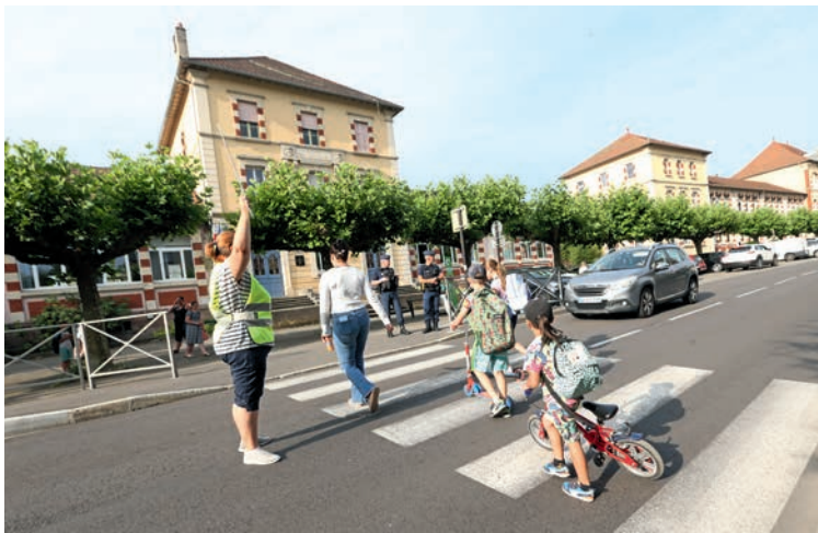
L'agent de sécurité et les policiers municipaux assurant la sécurité des enfants

La police municipale est présente régulièrement aux abords des écoles avec pour mission principale d'assurer la sécurité des enfants, des parents et des enseignants. Certains établissements (écoles Châteaudun, Émile-Géhant, Hubert-Metzger) ont un agent de sécurité qui fait traverser les enfants et participe aussi à l'animation périscolaire.