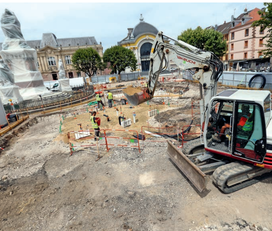
Un immense trou pour recevoir trois cuves de stockage d'eau pour le futur miroir d'eau

Si vous avez flâné place de la République cet été, vous avez sûrement vu une demi-lune de béton croître à l'ombre du monument des Trois-Sièges. C'est le futur miroir d'eau !