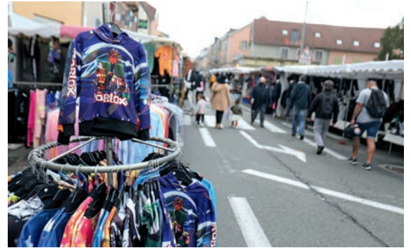
Un vaste choix de produits vous attend à la braderie de l'avenue Jean-Jaurès