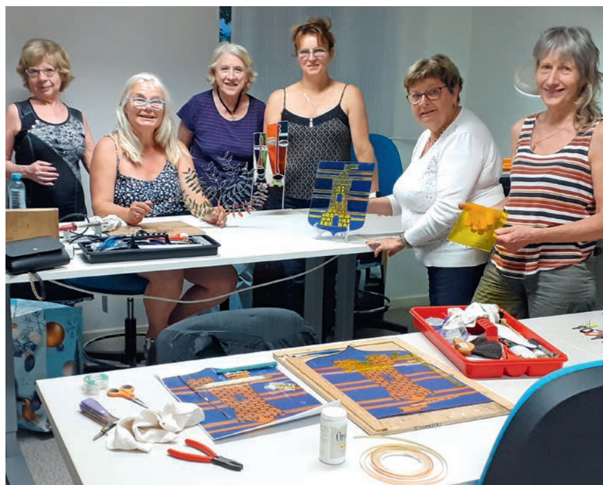
L'art du vitrail, l'une des activités proposées par l'amicale Miotte-Brisach

Cotisation : 20 € pour les Belfortains, 30 € pour les non Belfortains, 10 €/an pour l'ensemble des activités.