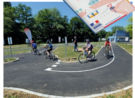
La piste d'initiation au vélo au parc François-Mitterrand