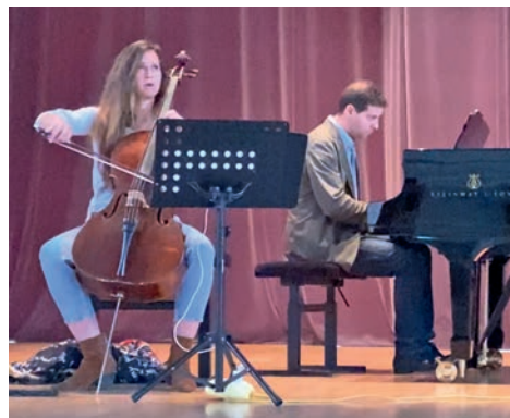
Le festival des Tourelles à la salle des fêtes depuis 2022

Du vendredi 29 septembre au dimanche 1 er octobre. Programme et réservations : festivaldestourelles.com et billetweb.fr/festival-des-tourelles3