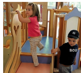
À la Parentèle, des locaux adaptés aux besoins des enfants

d'une cuisine pédagogique, inaugurés en juin dernier par Damien Meslot, maire de Belfort.