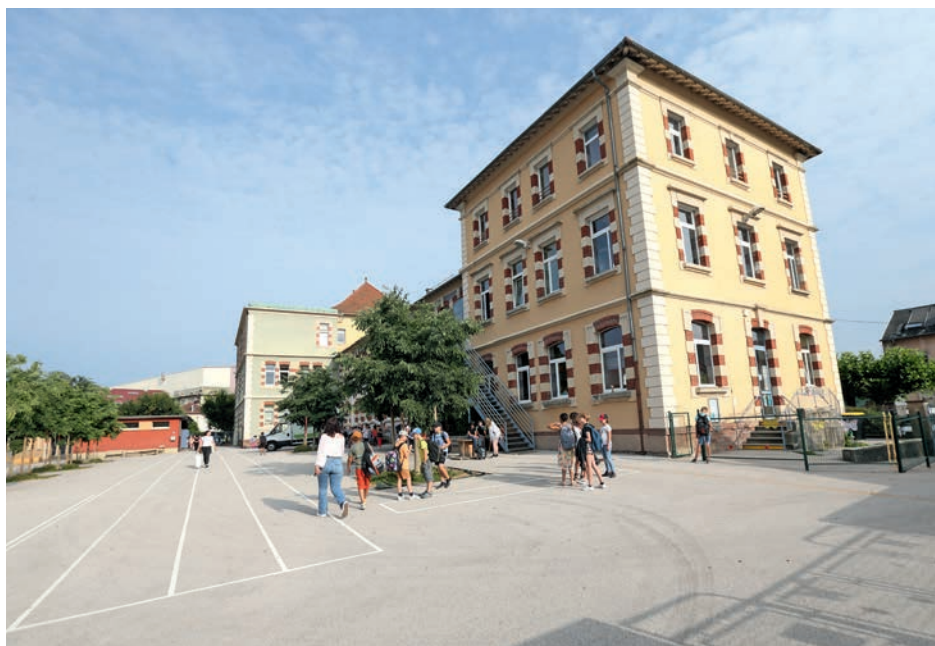
La cour de l'école élémentaire Raymond-Aubert rénovée en 2019

À travers son programme de rénovation des cours d'écoles, la Ville de Belfort améliore le confort et la sécurité des enfants.