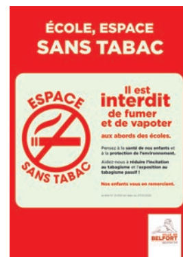
Les abords de toutes les écoles primaires sont des espaces sans tabac

C'est une façon de sensibiliser aux méfaits du tabagisme et de supprimer la cigarette du quotidien des enfants pour un mode de vie plus sain. Une signalétique spécifique a été mise en place par la Ville de Belfort.