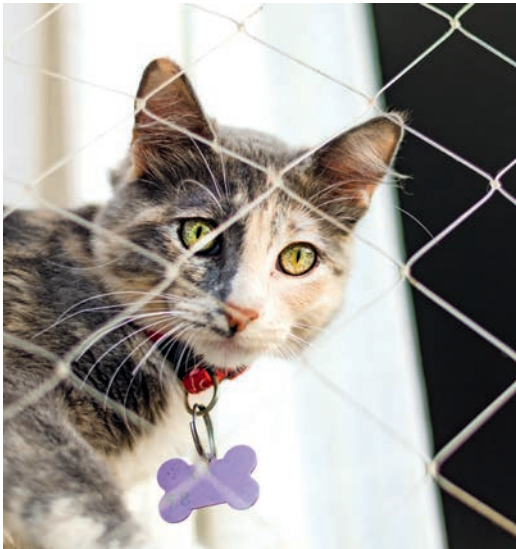
Les filets de protection, pour éviter les accidents