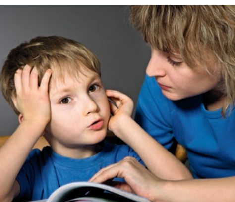
Apprendre à mieux communiquer avec son enfant grâce aux ateliers parentaux de la Ville de Belfort

La Ville de Belfort propose aux parents des ateliers pour les aider à mieux communiquer avec leurs enfants, grâce à un programme ludique abondant de multiples thèmes.