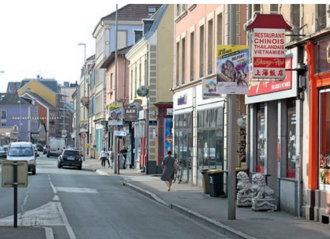
Avant d'ouvrir un commerce, quelques formalités sont nécessaires auprès de la Ville de Belfort