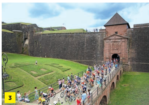
3 Les coureurs du Tour de France franchissant la porte de Brisach