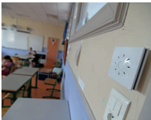
Un capteur de CO 2 pour mesurer le taux de dioxyde de carbone dans l'air

La Ville de Belfort a équipé toutes les salles de classe de capteurs de CO 2 qui mesurent le taux de dioxyde de carbone dans l'air.