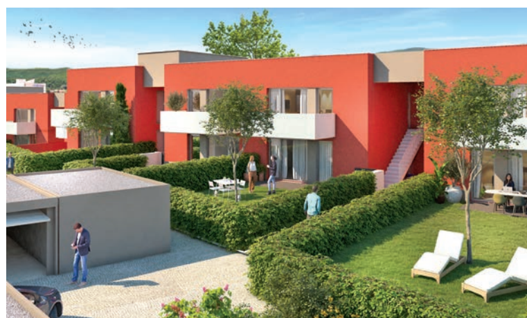
La future résidence Bartholdi proposera 16 appartements rue Henri-Dorey

Accessibles aux personnes à mobilité réduite, les logements disposeront tous d'une entrée privative, d'un espace extérieur (terrasse ou jardin), d'un garage et d'une place de stationnement. Ils bénéficieront d'une isolation thermique renforcée et des espaces verts offriront de la fraîcheur. Les eaux de pluie seront infiltrées dans le sol pour favoriser le remplissage de la nappe phréatique.