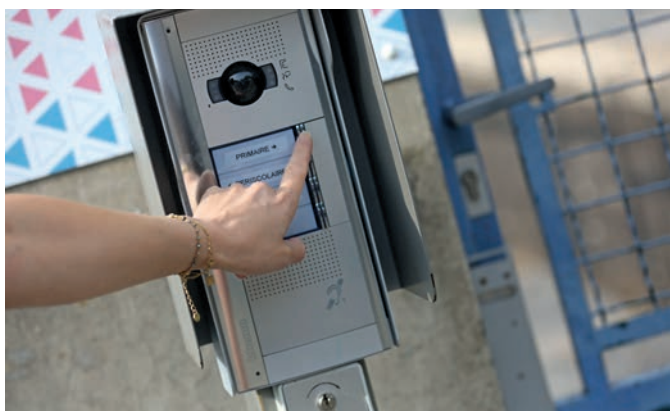
Le système de visiophonie permet de filtrer les entrées

Toutes les écoles primaires belfortaines disposent aujourd'hui d'un système de visiophonie. Cet équipement permet de filtrer les entrées dans les établissements lorsque le portail est fermé. Le personnel enseignant peut l'ouvrir à distance, depuis l'intérieur des bâtiments.