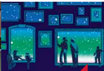
Nuit européenne des musées