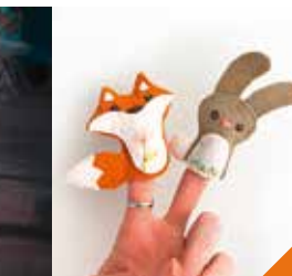
Marionnettes à doigts