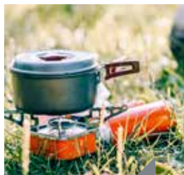
Préparer son bivouac