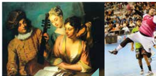
Concert violes de gambe