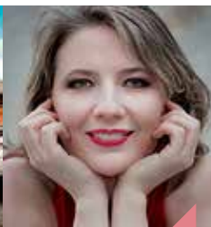
Louanges et vanités