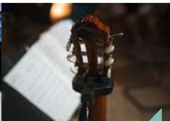
Musique au musée