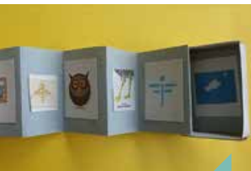
À la manière d'un leporello