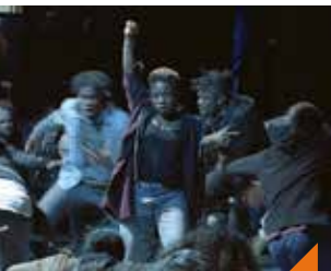
Atelier danse hip-hop