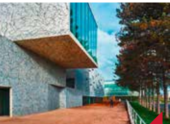
Portes ouvertes du conservatoire