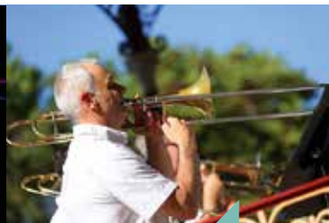
Kiosque en fête