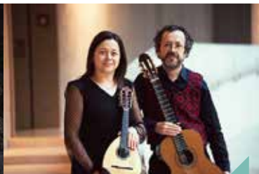
Musique au musée