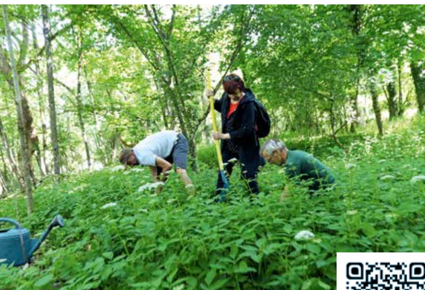
Des Belfortains motivés pour améliorer ensemble notre cadre de vie lors de l'édition 2022

Nettoyer, désherber, entretenir : améliorons ensemble notre cadre de vie, le tout dans la bonne humeur ! C'est le principe de la journée citoyenne qui aura lieu le samedi 13 mai.