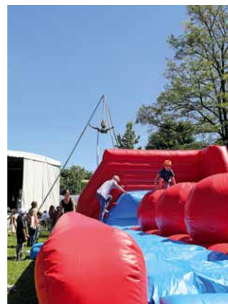
Des structures de jeux gonflables lors de l'édition 2022

Rendez-vous le samedi 13 mai pour la fête de l'enfance et de la famille, pour jouer et se détendre ensemble.