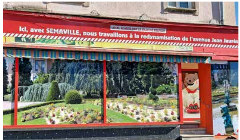
Le local de l'ancien restaurant indien Jaipur a été racheté par la Ville de Belfort pour lui donner une nouvelle vie grâce à Semaville

*Le droit de préemption permet à la Ville de Belfort d'être prioritaire pour l'achat d'un bien