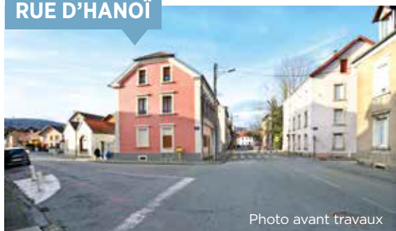
Photo avant travaux

L'intersection avec la rue Jules-Ferry a été restructurée en avril pour la sécurité des piétons : les trottoirs qui étaient très étroits ont été élargis et un passage piétonnier permet de traverser la rue.