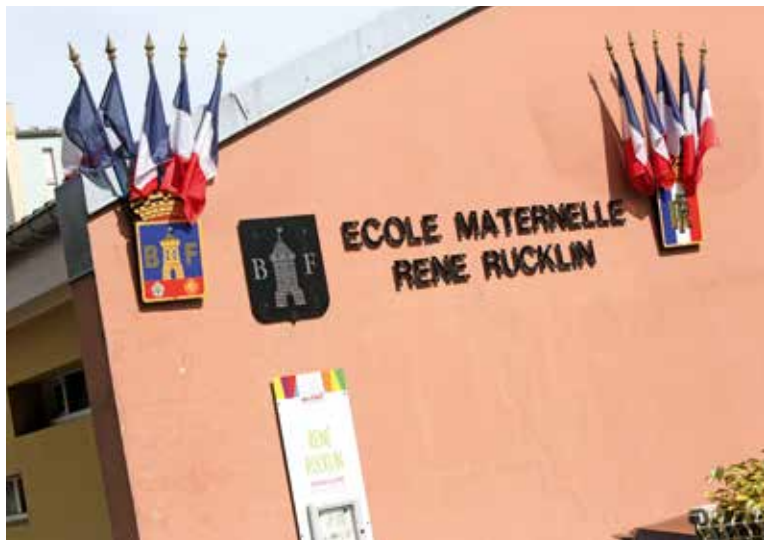
L'école maternelle René-Rücklin va être entièrement transformée

L'école maternelle René-Rücklin va bénéficier d'un grand programme de rénovation. À la rentrée 2024, les enfants retrouveront un environnement complètement transformé.