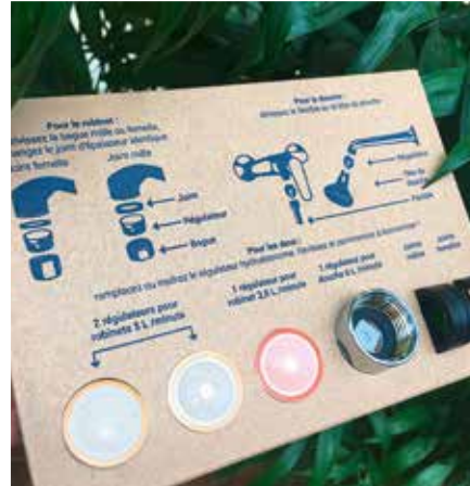
Quatre régulateurs offerts par le Grand Belfort pour réduire votre consommation d'eau

L'assemblage du kit se fait en France, dans un ESAT (établissement et service d'aide par le travail). Son emballage est recyclable et pour chaque kit acheté par le Grand Belfort, un arbre est planté à Madagascar grâce à un partenariat avec l'ONG Graine de Vie.