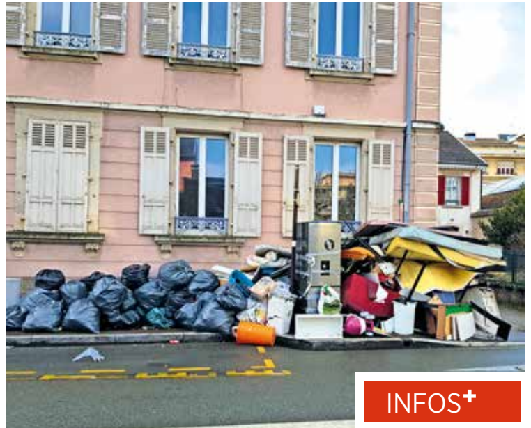
Un dépôt sauvage rue Denfert-Rochereau, qui défigure notre ville