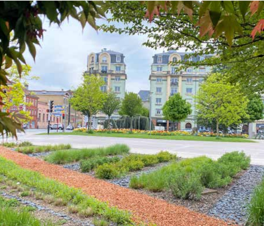
Des plantes vivaces pour orner la place Yitzhak-Rabin

Pour la Ville de Belfort, 2023 constitue une année bien particulière. Elle va en effet mener un test grandeur nature de sa nouvelle approche du fleurissement.