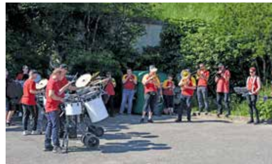
Un peu de musique pour encourager les marcheurs lors de l'édition 2022

L'Office municipal des sports remet le couvert pour sa 2 e marche gourmande, dimanche 14 mai. Un circuit de 7 km avec six étapes gourmandes et locales, de l'apéritif au dessert, ponctué par les plus beaux monuments de Belfort, un partenariat avec le théâtre du Granit et le soutien de la Ville de Belfort.