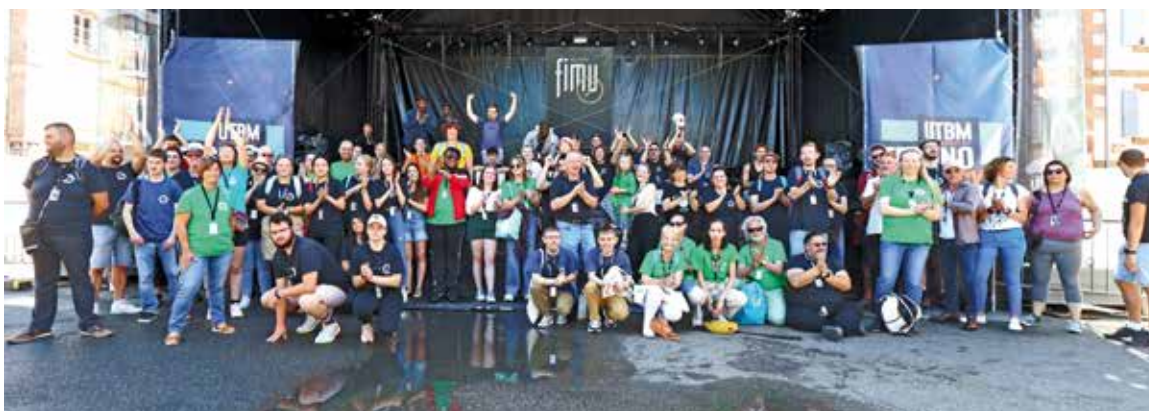
Au FIMU, les bénévoles sont majoritairement des étudiants de l'UTBM

Il y a 30 ans, l'association des étudiants de l'UTBM créait le FIMU. Aujourd'hui, elle continue à soutenir la Ville de Belfort dans l'organisation de ce grand événement populaire. Concrètement, elle encadre les bénévoles qui sont en grande partie étudiants, prend en charge une partie de la gestion technique (son et lumière) de la scène Campus, participe à l'accueil du public et contribue ainsi à la bonne marche du FIMU.