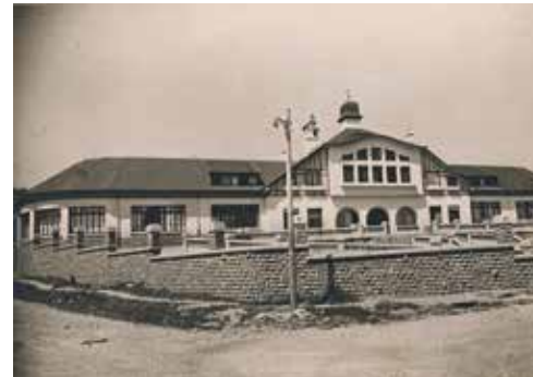
L'école du Mont, construite dans le cadre du plan d'embellissement et d'extension dans l'entre-deux-guerres