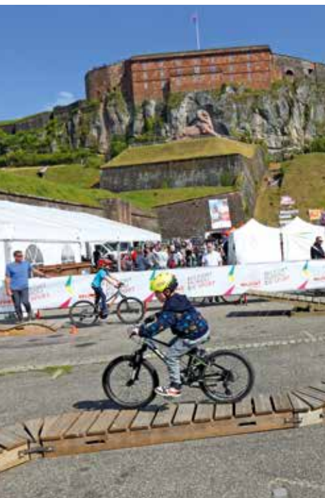
Des petits parcours aménagés pour les enfants à la fête du vélo

Belfort, ville amie du vélo, participe à Mai à vélo avec des rendez-vous à ne pas manquer.