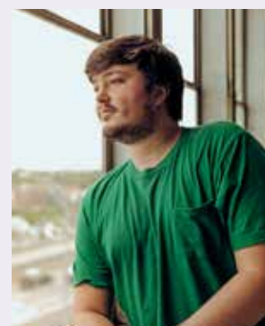
Émile Bilodeau, le parrain du 36 e FIMU

Ce chanteur folk québécois s'est fait connaître du grand public en 2016 avec son premier album, Rites de passage. S'ensuit une tournée qui l'amène en Europe sur des scènes belges et françaises. Son 3 e album, Tout seul comme un grand, où il signe paroles et musique, est sorti fin 2022.