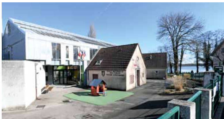
L'école maternelle Pauline-Kergomard et l'école élémentaire Jean-Moulin, rue Charles-Steiner