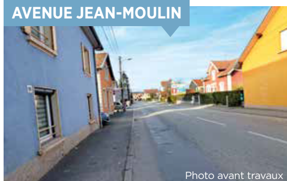
Photo avant travaux

La Ville de Belfort a refait en avril les trottoirs côté ouest, entre l'avenue du Champ-de-Mars et la commune d'Offemont. Un chantier en coordination avec le conseil départemental qui va mener la réfection de la chaussée durant l'été.