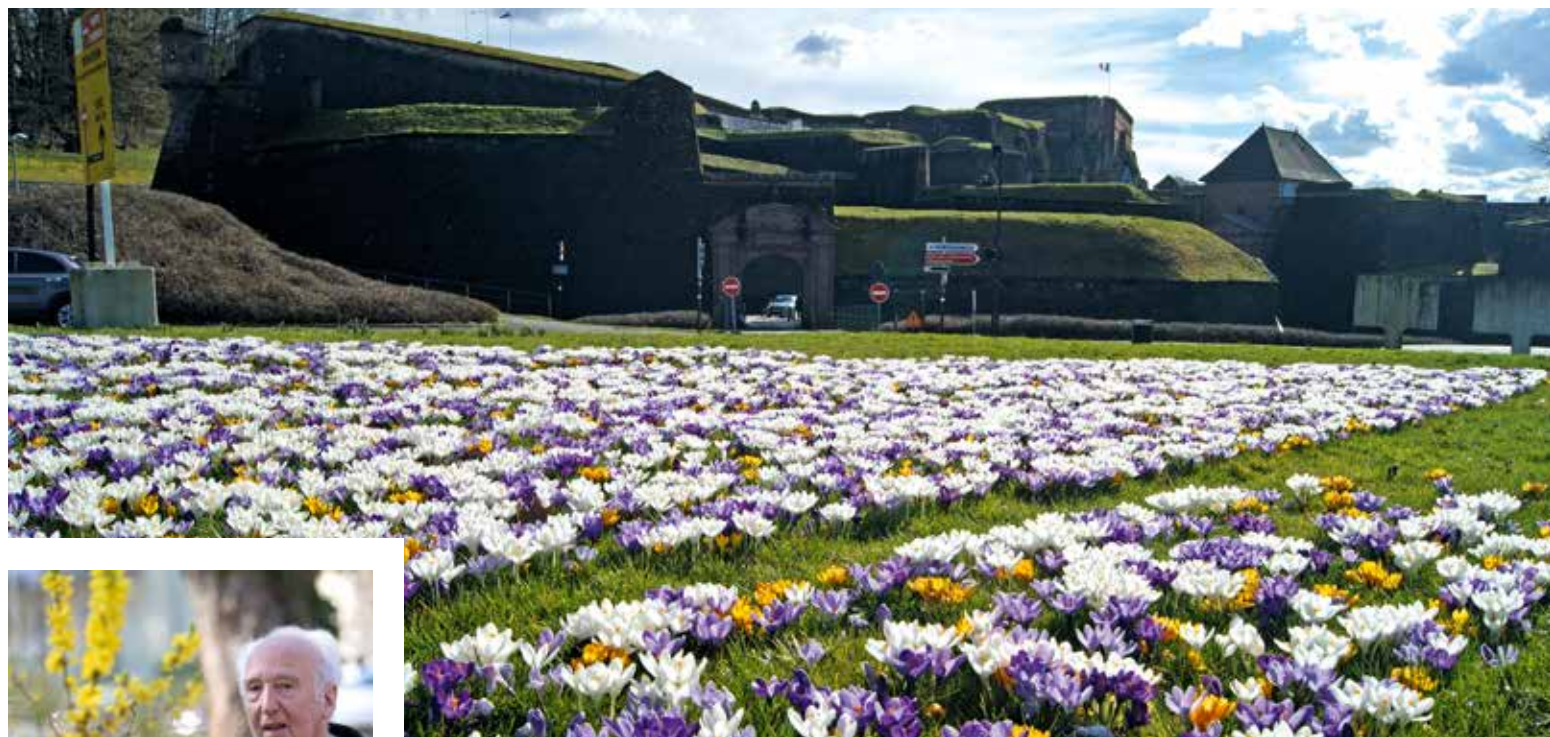
Des crocus, fleurs vivaces, pour valoriser notre ville dès la fin de l'hiver

Comment avoir une ville fleurie et attractive avec des étés de plus en plus chauds, de plus en plus secs ? À Belfort, on teste cette année le fleurissement du futur, plus durable, plus économe en eau et moins cher. Vous allez découvrir dans les prochains jours ce fleurissement audacieux, qui rompt avec les habitudes.