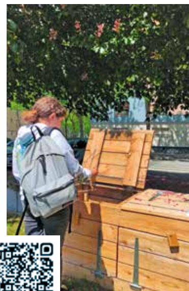
Ce composteur collectif a vu le jour grâce au budget participatif