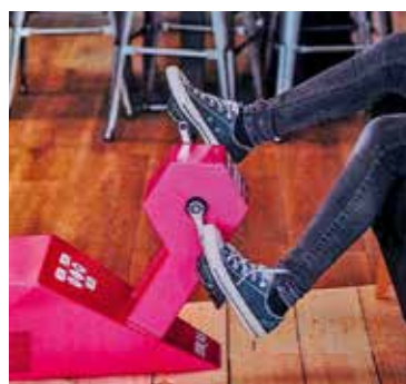
Une borne à pédales pour recharger des téléphones portables, le projet retenu dans le cadre du budget participatif du conseil municipal des enfants

votes. Elles seront installées dans deux centres culturels et sociaux Oïkos. Le calendrier des jeunes élus est bien chargé pour la fin de l'année scolaire : ils chanteront La Marseillaise lors de la cérémonie du 8 mai et se rendront une journée à Paris où ils visiteront l'Assemblée nationale et le musée d'Orsay.