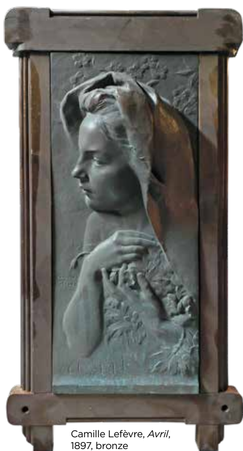
Camille Lefèvre, Avril , 1897, bronze