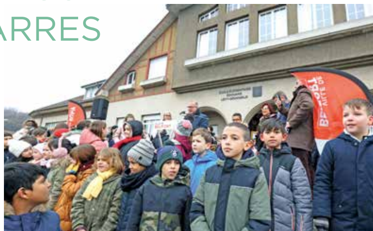
Le baptême de l'école Édouard-Lévy-Grunwald par Damien Meslot, maire de Belfort, le 2 mars dernier

nom, mais depuis sa démolition, plus rien n'évoquait l'action de ce maire qui a transformé le visage de notre ville. Rien, jusqu'à l'installation d'un buste le représentant à l'annexe Bartholdi de l'Hôtel de Ville en mai 2022, à la demande de Damien Meslot, maire de Belfort.