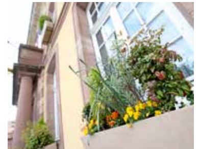
Les jardinières de l'Hôtel de Ville sont une illustration du nouveau fleurissement adopté par la Ville de Belfort, mêlant plantes vivaces et fleurs annuelles ou bisannuelles

Le fleurissement de l'Hôtel de Ville a déjà évolué. Les jardinières sont occupées à 80 % par des vivaces : hellébores, osmanthes, corokias..., auxquelles s'ajoutent des bisannuelles comme les pensées. Lorsque les vivaces sont trop grandes, elles sont rempotées et utilisées pour de la décoration et les bulbes donnés aux écoles. Une illustration de la voie empruntée par la Ville de Belfort.