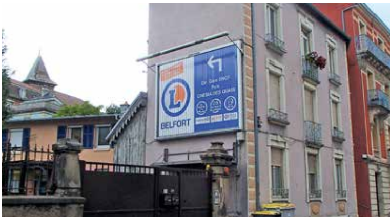
Un règlement local de publicité pour réduire la taille des panneaux publicitaires (simulation)