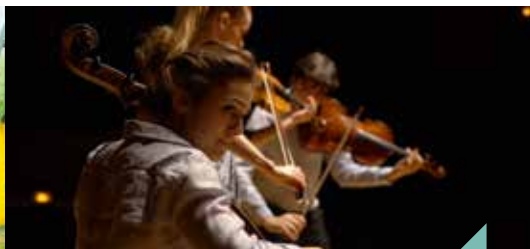
Musique de chambre