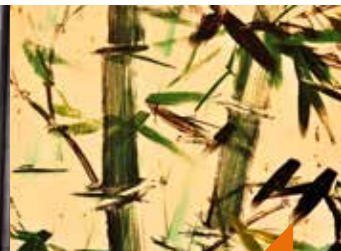
Arts et traditions d'Asie