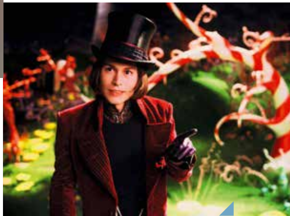
Charlie et la chocolaterie