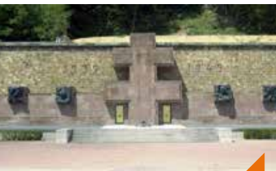
Le Mont Valérien