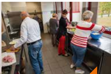
Atelier des seniors