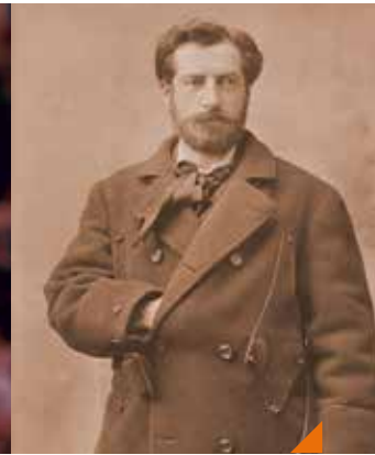
Le tournoi des trois sculpteurs