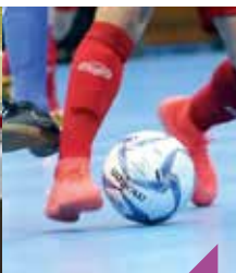
Tournoi de futsal