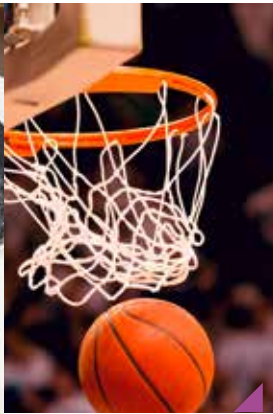
Tournoi de basketball