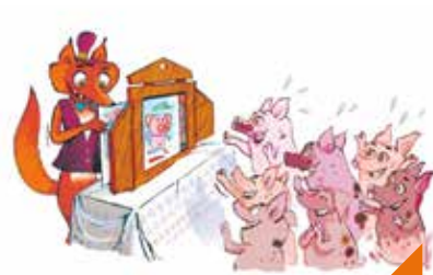
La boîte magique