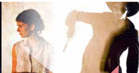
Une nuit américaine