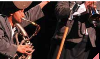
Labiche malgré lui