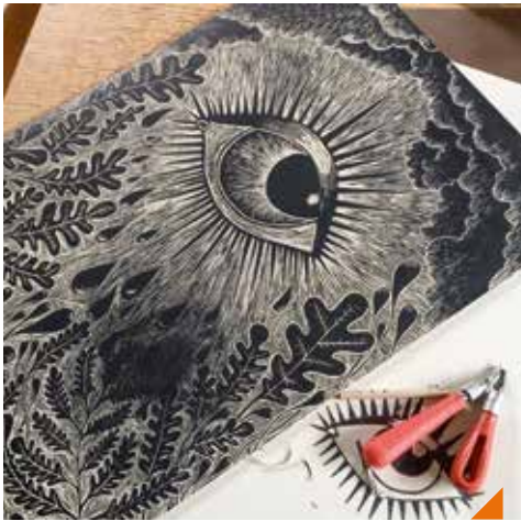
Le zoo d'Auguste