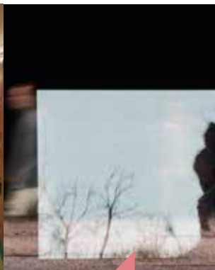
Jour et nuit