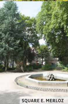
SQUARE E. MERLOZ