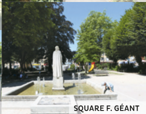
SQUARE F. GÉANT