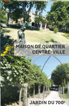
MAISON DE QUARTIER CENTRE-VILLE