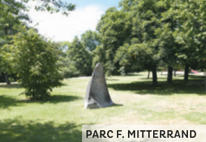
PARC F. MITTERRAND