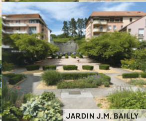
JARDIN J.M. BAILLY