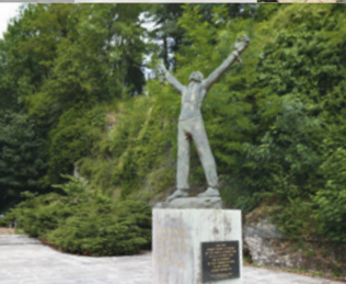
SQUARE M. BRAUN