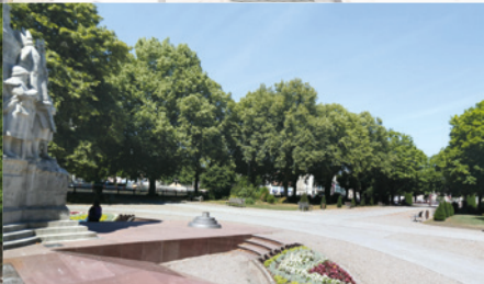
SQUARE DU SOUVENIR