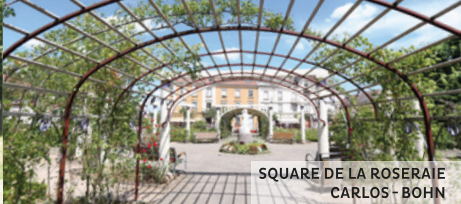
SQUARE DE LA ROSERAIE CARLOS-BOHN