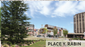
PLACE Y. RABIN