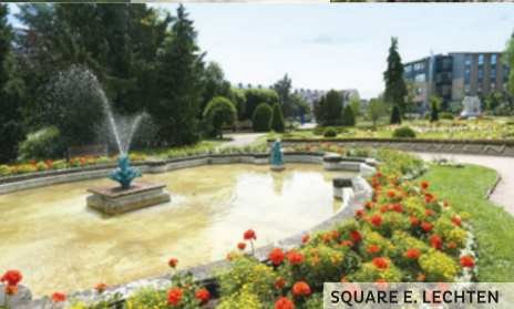
SQUARE E. LECHTEN