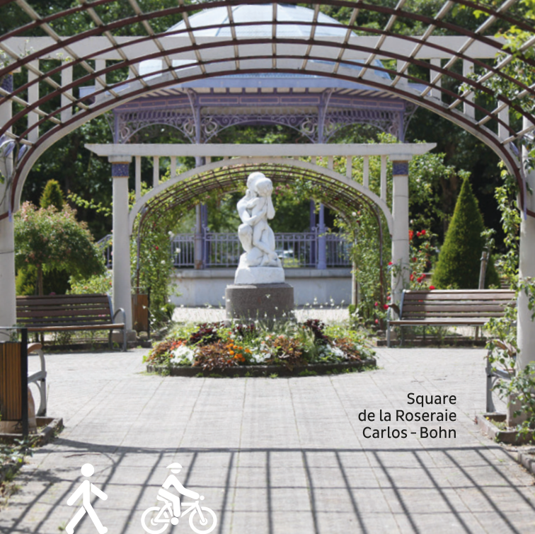
Square de la Roseraie Carlos - Bohn

Un parcours qui invite à la flânerie dans les squares, parcs et jardins de Belfort et à la découverte d'arbres de grand intérêt qui ornent ces espaces.