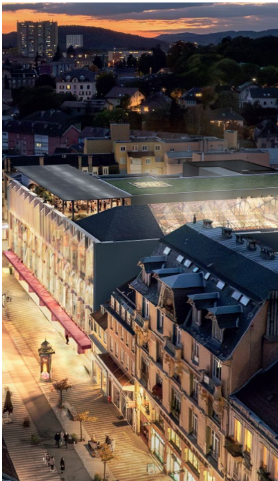
Un accès indépendant permettra de rejoindre directement le casino, situé au 3 e étage, sans passer par les Nouvelles Galeries.

Fort de son label Ville Touristique, la Ville de Belfort annonce aujourd'hui son projet d'implantation d'un casino en cœur de ville . Cette opportunité majeure permettra de diversifier l'offre de loisirs, de dynamiser l'économie locale et de renforcer le rayonnement du territoire. Pensé comme un véritable lieu de vie, de rencontre et de divertissement, ce futur équipement contribuera pleinement à l'attractivité du centre-ville.