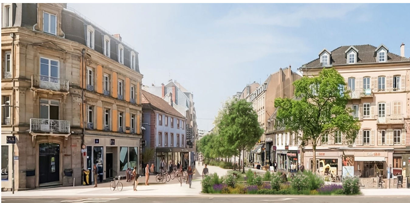
Rénovation et végétalisation du Faubourg de France

> Aménagements spécifiques : Trois zones feront l'objet d'une attention particulière : l'entrée végétalisée depuis la place Corbis, le parvis des Nouvelles Galeries réinventé et l'intersection avec la rue Proudhon, où l'aménagement sera repensé pour remplacer l'actuelle fontaine De Rougemont.