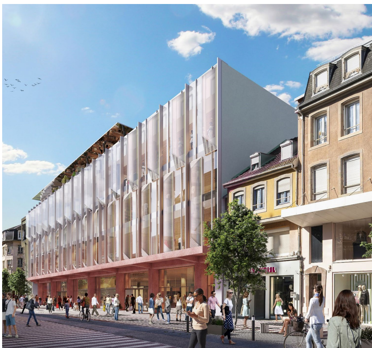
Transformation du bâtiment des Nouvelles Galeries

Pour ce nouveau mandat, la Ville de Belfort franchit une étape décisive dans la transformation du faubourg de France. Lieu de vie, de commerce et de rencontres, cette artère commerçante doit aujourd'hui évoluer pour répondre aux nouveaux usages et aux attentes des Belfortains. Entre préservation de l'héritage et impulsion de nouveaux services, ce projet vise à renforcer durablement l'attractivité de la Cité du Lion auprès des Belfortains, des commerçants et des visiteurs.