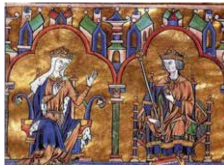
Blanche de Castille et son fils Louis IX. Psautier de saint Louis, Manuscrit, latin 10525. BNF. Vers 1274.

Étudier l'art du Moyen-Âge, c'est traverser les portes du temps. L'art médiéval est multiple, foisonnant et passionnant.