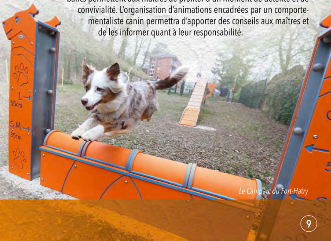
Le Caniparc du Fort-Hatry

Un second Caniparc, situé vers l'Etang des Forges, a ouvert durant l'été 2023. Espaces entièrement dédiés à nos amis les chiens, accessibles à tous, ils sont dotés de toutes les sécurités nécessaires pour libérer votre chien de sa laisse et le laisser profiter d'une vaste superficie équipée de 10 agrès d'agility. Une fontaine est à disposition et des bancs permettent aux maîtres de profiter d'un moment de détente et de convivialité. L'organisation d'animations encadrées par un comportementaliste canin permettra d'apporter des conseils aux maîtres et de les informer quant à leur responsabilité.