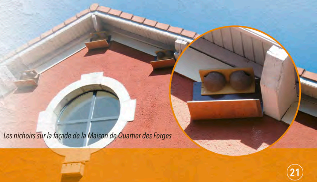
Les nichoirs sur la façade de la Maison de Quartier des Forges