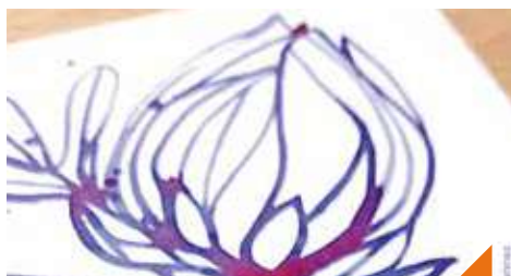
Découvre la magie de l'encre de fleur d'hibiscus