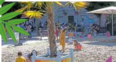
La Plage du Lion