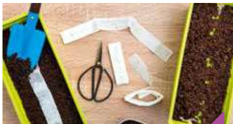
Fabrication du papier ensemencé