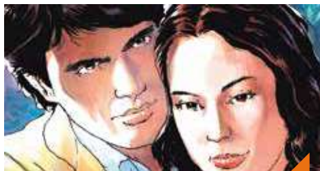
Ciné-BD-Concert : « Et si l'amour c'était aimer ? »