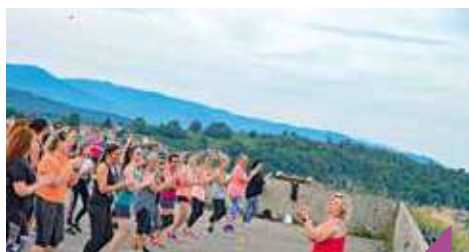
Zumba à la Citadelle