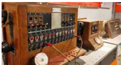
100 ans de télécommunication dans le Territoire de Belfort