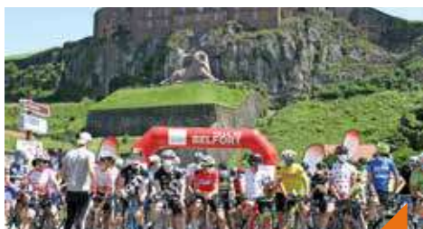
Tour du Territoire de Belfort