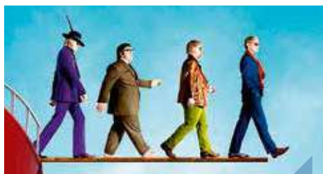
Cinéma en plein-air : Good morning england