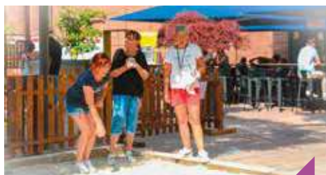
Initiation à la pétanque