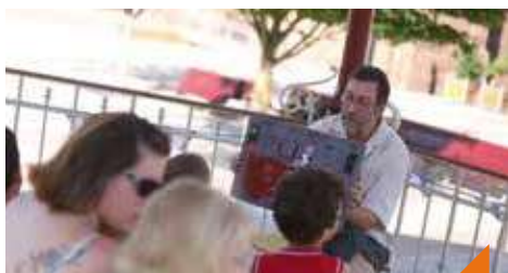
Lectures de la bibliothèque municipale