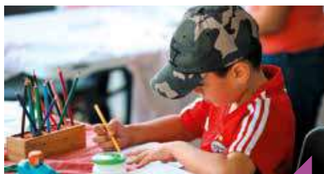
Fabrique et donne vie à ta marionnette