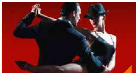
Initiation au tango argentin