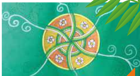
Carte mandala estivale