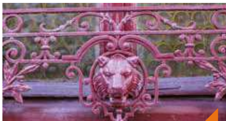
Visite guidée le safari des lions