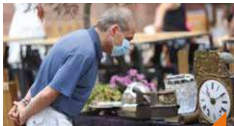
Marché aux puces