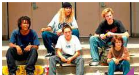
Cinéma en plein-air : « 90's »