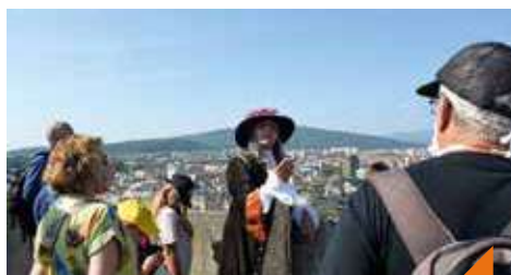
Spectacle : un architecte au service du Roi-Soleil