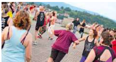
Zumba à la Citadelle