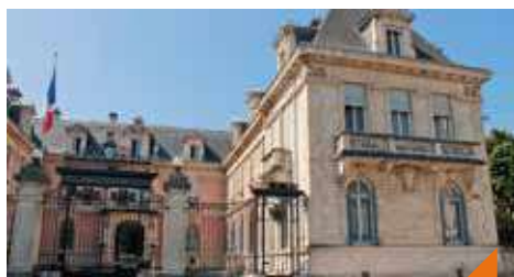
Visite guidée : la naissance d'un territoire