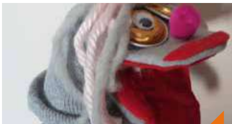
Crée ta marionnette avec des chaussettes