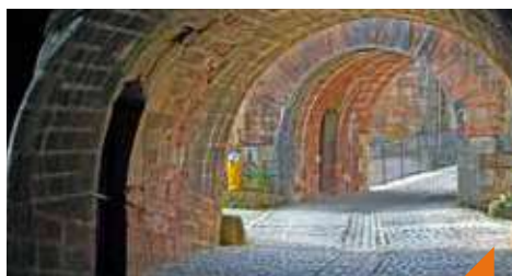
Visite de la Citadelle