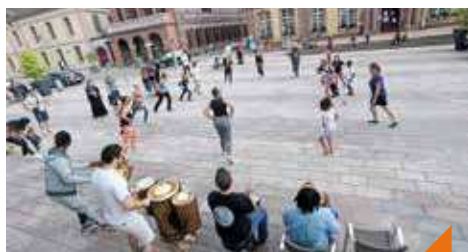
Danse africaine et percussions