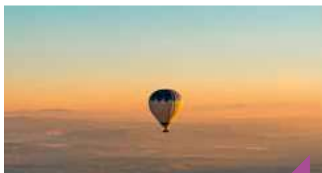
Championnat de France de montgolfières