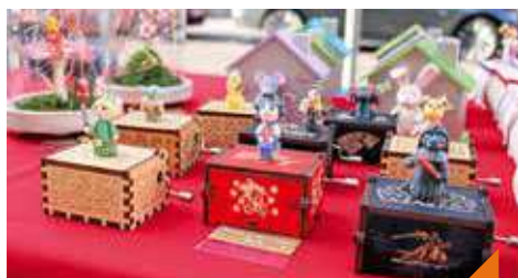
Le marché des producteurs locaux