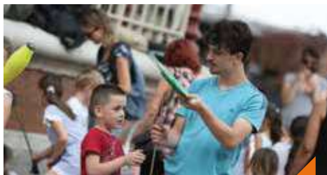
Initiation au cirque