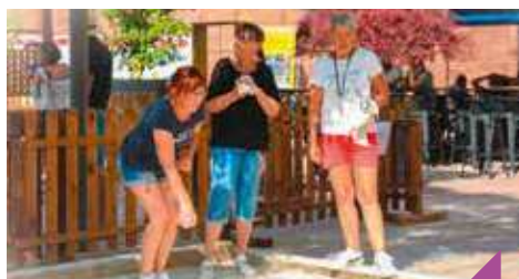
Initiation à la pétanque