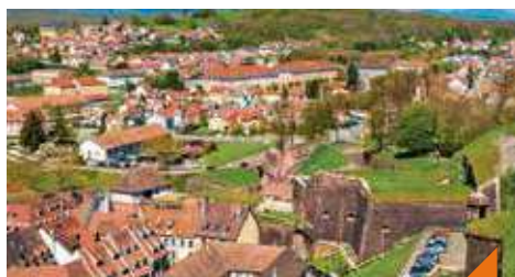
Visite de la Citadelle