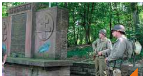
Visite : les oubliés du Salbert