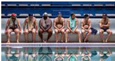
Projection du film "Le grand bain"