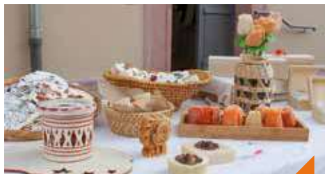
Le marché des producteurs locaux