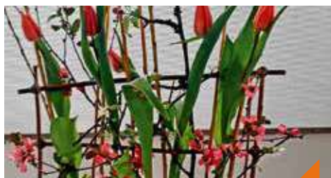
Atelier végétal : tissage végétal