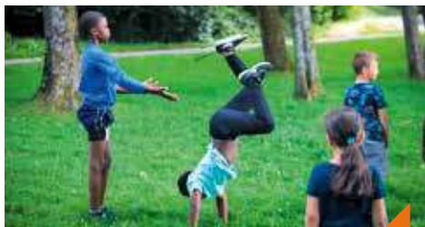
Initiation au hip-hop