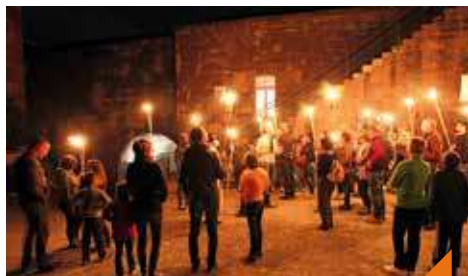
Visite : le siège de Belfort à la lueur de flambeaux