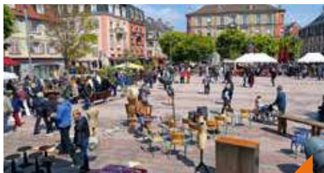
Marché aux puces