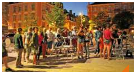
Veillée aux étoiles