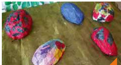
Fabrication de scarabées en papier mâché