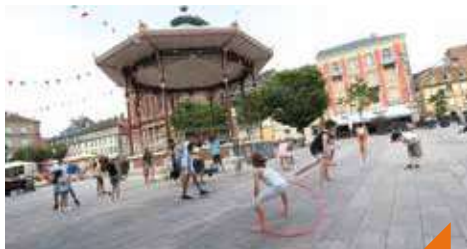
Initiation au cirque