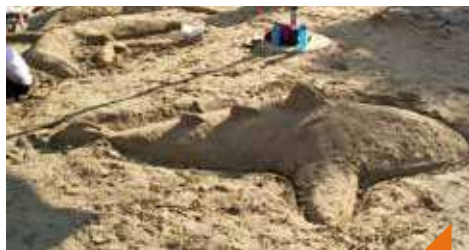
Initiation à la sculpture sur sable