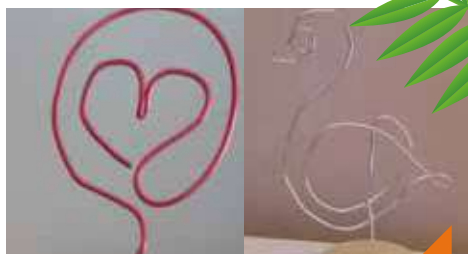
Réalisation de sculptures en fil d'aluminium