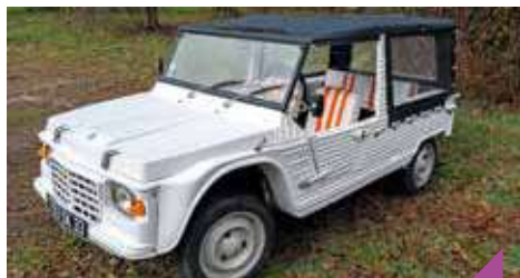
La fête du cabriolet