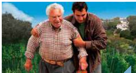
Le jardin de mon grand-père