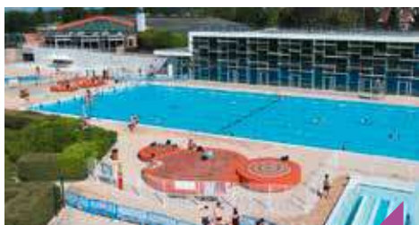
Baptêmes de plongée