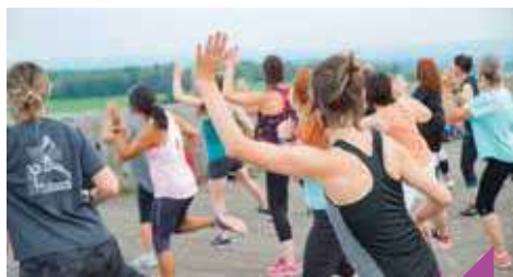
Zumba à la Citadelle