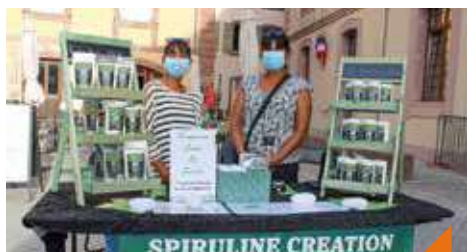
Le marché des producteurs locaux