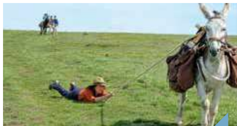
Projection du film "Antoinette dans les Cévennes"