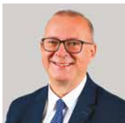
Damien MESLOT Maire de Belfort