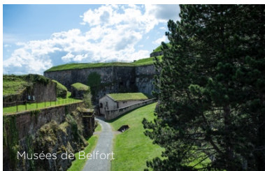
Musées de Belfort