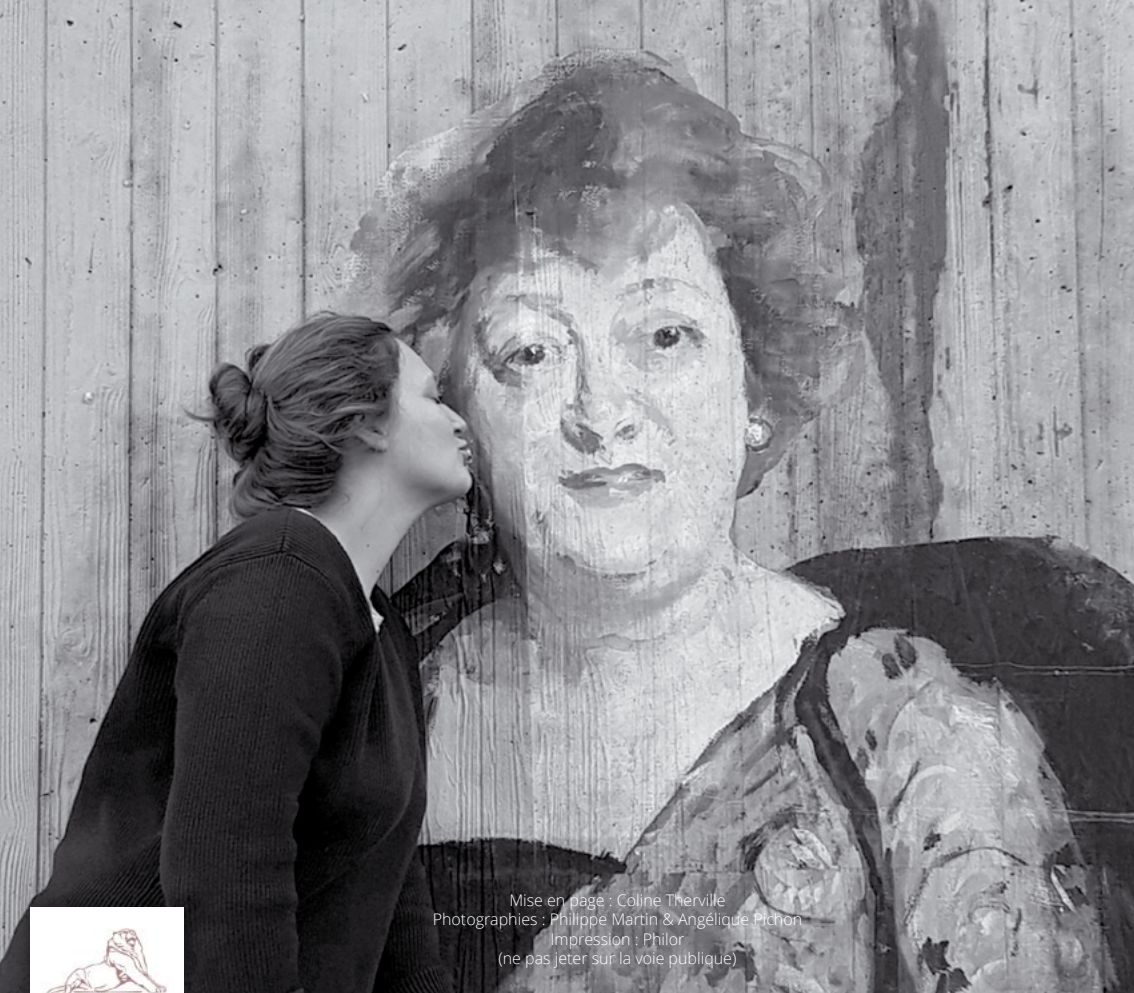
Mise en page : Coline Therville Impression : Philor (ne pas jeter sur la voie publique)