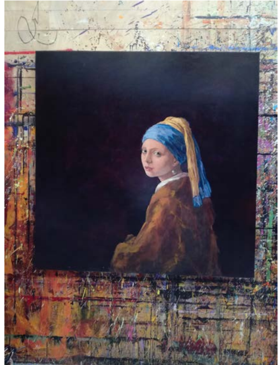
« égards, Vermeer »

Durée : 1 h 30 - Sur réservation au 03 84 54 56 40