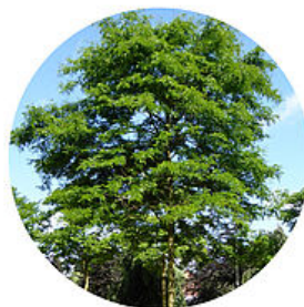
Févier d'Amérique sans épines