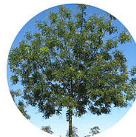
Sophora du Japon