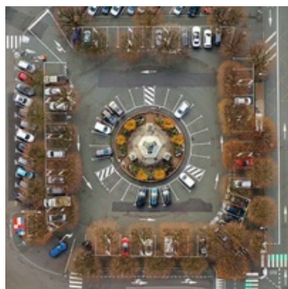
Vue aérienne avant et après restauration.