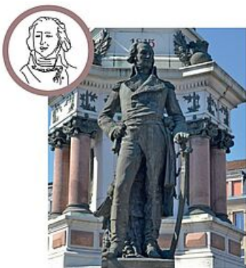
Général Claude-Jacques Lecourbe / 2e siège de 1815