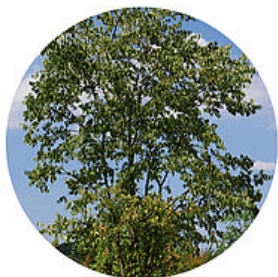
Micocoulier de Provence