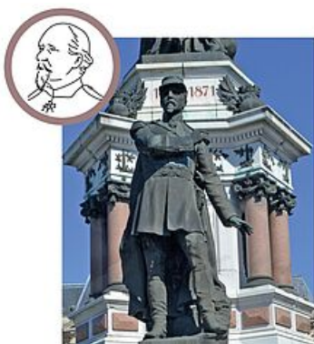
Colonel Aristide Denfert-Rochereau / 3e siège de 1870