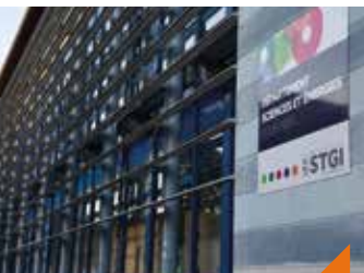
Portes ouvertes de l'Université