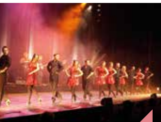
Avalon Celtic Dances