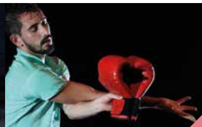
Rock & Goal