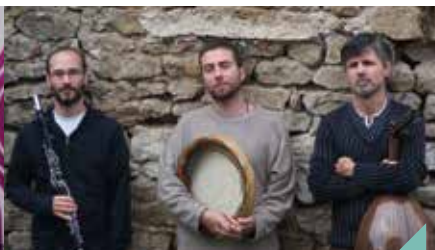
Concert de Talawine, jazz oriental