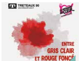
Concert au profit des Restos du Cœur