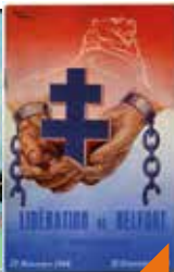
S'engager pour libérer la France