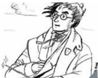
En quoi Harry Potter...