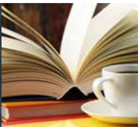
Cherchez La Faute