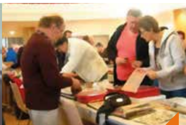
42 e bourse toutes collections