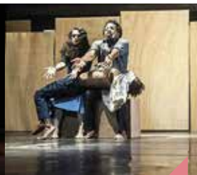
Nuit blanche à Ouagadougou