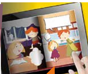
Concerto de chambre