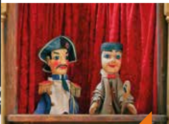
L'histoire véritable de Guignol