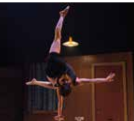
Réversible - Les 7 doigts de la main