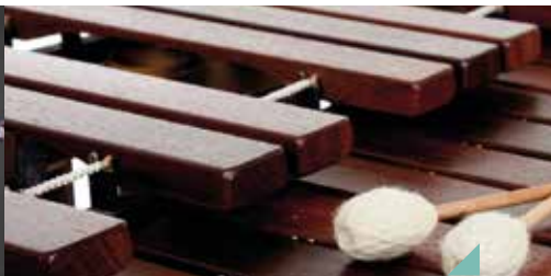
Autour des claviers à percussion