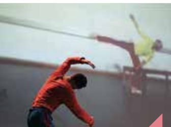
Un acte sérieux