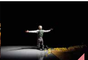
Ludwig, un roi sur la lune