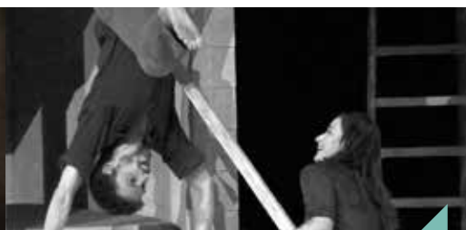
Le goût du Nord