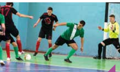
Grand tournoi de futsal U11 et U13