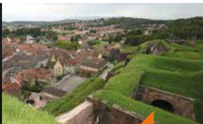
La Citadelle d'hier à aujourd'hui