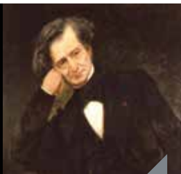
Berlioz et les Troyens