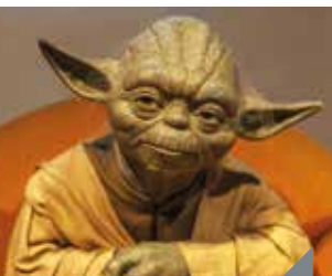
Star Wars, réalité ou fiction ?