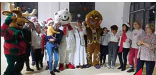
Fête de Noël