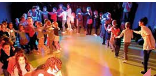
Le Bal des Éléments