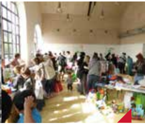
Bourse aux vêtements d'hiver