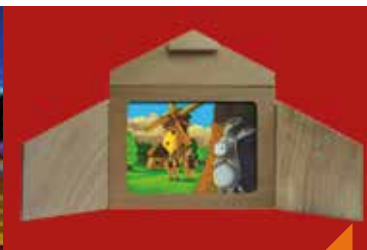
Kamishibais de Noël