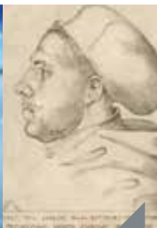
Causerie : Luther