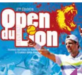
Open du Lion