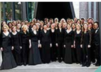
Orchestre de chambre de Bâle