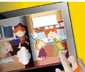
Tout p'tits clics