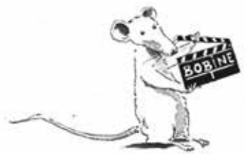
P'tits yeux : projection surprise