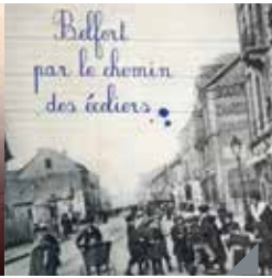
Belfort et ses écoles