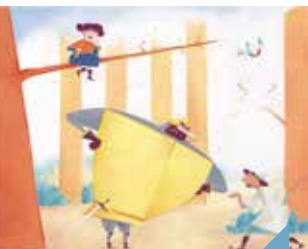
Le vent dans les roseaux