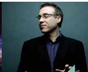
Un requiem imaginaire