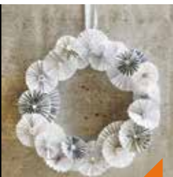
Couronne de l'aveint