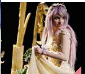
Amour et Psyche