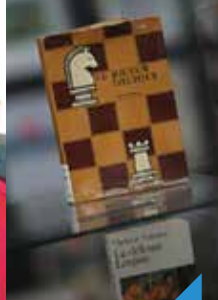
Les trésors de la bibliothèque