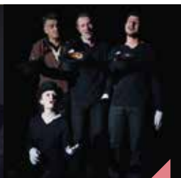
Les marchands de fables