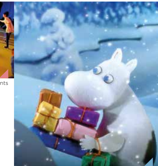
Le Noël des Moomins

HANDBALL : BAUHB/GRENOBLE Gymnase Le Phare, à 20h15