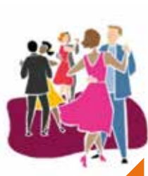
Thé dansant La Ritournelle