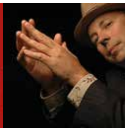
La leçon de jazz