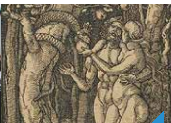
Une histoire de l'art reproductible