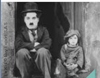
Ciné-concert : The Kid