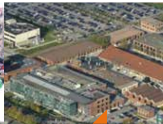
Visite de Techn'hom