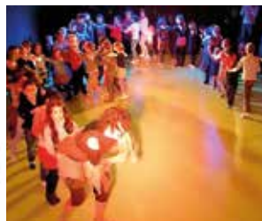
Le bal des éléments