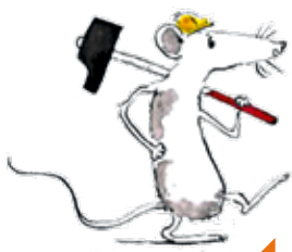
P'tites mains : Décoration surprise