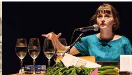
La possible impossible maison