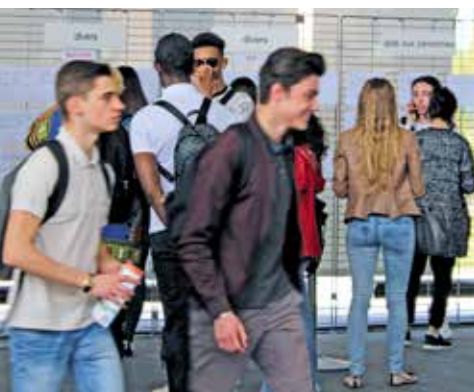
Le forum des jobs d'été, pour les jeunes qui cherchent un emploi

Si vous souhaitez signaler une situation de détresse, lors des grands froids notamment, appelez le numéro d'urgence sociale : 115. L'appel est gratuit depuis un poste fixe ou un portable et possible toute l'année, tous les jours, y compris les week-ends et jours fériés, 24 h sur 24. Vous pouvez aussi contacter la police municipale au 03 84 54 27 00.