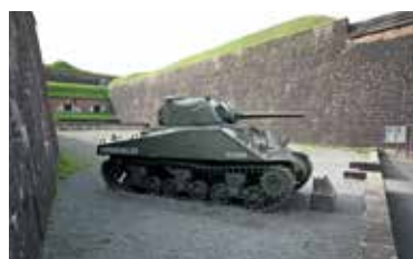
La place du char Martin, aujourd'hui très minérale, sera végétalisée