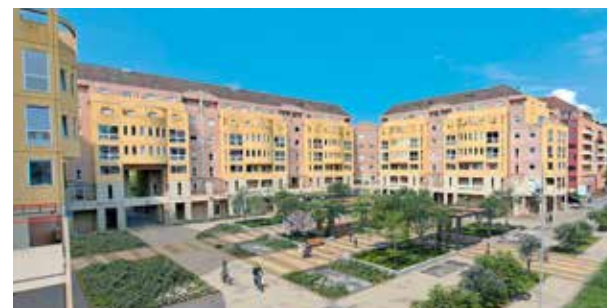
La future place de Franche-Comté

De multiples chantiers permettront aussi d'améliorer la qualité de vie des habitants : rues Marcel-Bonneff, de Cambrai, du Canon d'Or, du Magasin, Édouard-Mény, Jules-Michelet (trottoirs), du Général-Reiset, de Thann (création d'un parking à l'emplacement de l'immeuble incendié), via d'Auxelles (2 e tranche), faubourg de Lyon, place de Franche-Comté..., projets auxquels s'ajoute la fin des travaux place de la République !