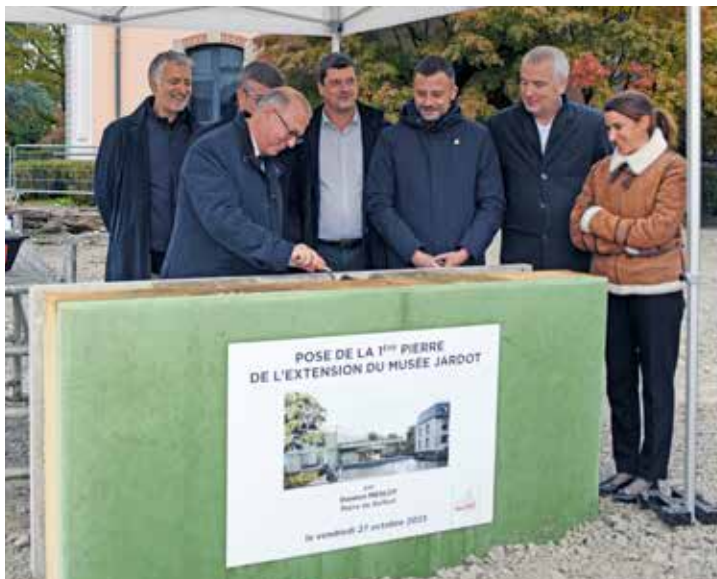
La première pierre du futur pôle muséal a été posée le 27 octobre dernier

Après une phase de terrassements qui s'est déroulée pendant l'été et l'automne, puis une phase d'aménagement des différents réseaux : eau, gaz, électricité, chauffage et ventilation, etc., la construction des murs du sous-sol devrait commencer en janvier-février. Une phase qui dépend des conditions