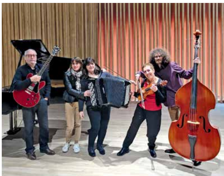
Caminos del Tango, l'un des ensembles qui animeront la Nuit des conservatoires

La Nuit des conservatoires, le 26 janvier, est l'occasion d'assister gratuitement à des concerts de toutes sortes de musiques, des cuivres autrichiens à la techno !