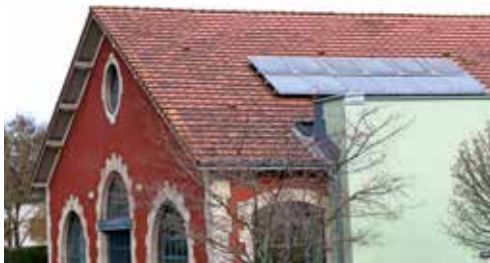
Des panneaux photovoltaïques déjà installés sur le toit de la maison de quartier municipale des Forges

Des études (160 000 € HT) pour déployer des panneaux photovoltaïques sur les toits de 13 bâtiments municipaux (travaux de 2025 à 2027).