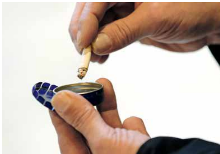
Des cendriers pour éviter de jeter ses mégots par terre sont en cours de distribution par la Ville de Belfort

En plus des éteignoirs qui équipent certaines poubelles urbaines, des cendriers sur pied seront placés,