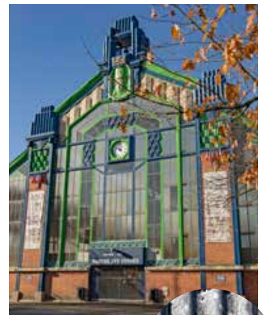
La toiture très abîmée par l'orage du 26 juin 2022 sera réparée au 1 er semestre 2024

Fin 2023, la halle du marché des Vosges a été emmaillottée d'échafaudages, prélude aux travaux qui démarrent en ce début d'année 2024.