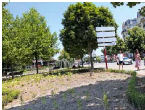
La première tranche des jardins d'Afula menée à bien en 2023

L'environnement est un fil rouge, ou plutôt vert, de l'action municipale.