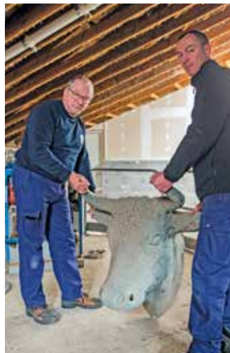
Cette impressionnante tête de bœuf était l'un des ornements du marché Fréry

La fin des travaux est prévue à l'automne. Vous retrouverez alors un marché Fréry fidèle à ce que ses architectes avaient imaginé au siècle dernier.