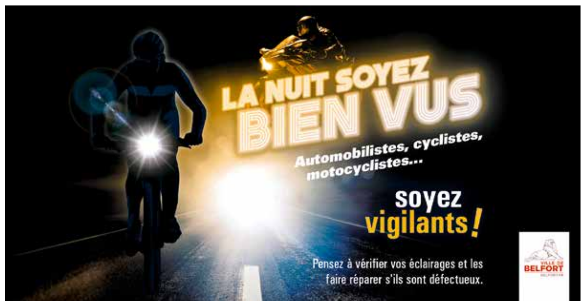
La Ville de Belfort relance sa campagne de communication pour la sécurité des Belfortains

Si vous circulez à vélo, vérifiez que celui-ci est équipé de cata-