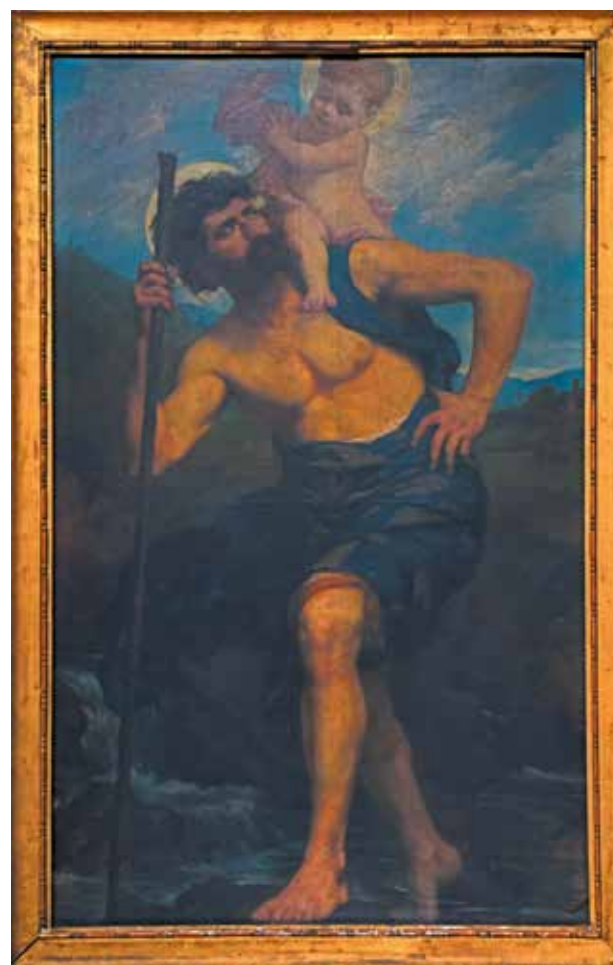
Saint Christophe et le Christ