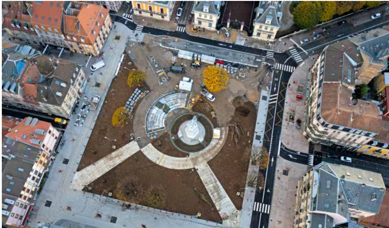
La place de la République vue du ciel

Les voies bordant le tribunal et la salle des fêtes (côté nord de la place), les commerces et restaurants (côté est) ont laissé place à de vastes espaces piétonniers bien visibles à gauche et au bas de la photographie. On distingue aussi, déjà dressés le long de la place et des allées ou couchés sur le sol, les nouveaux arbres