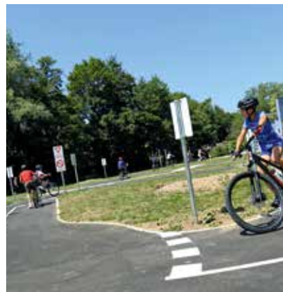
Composteurs collectifs, caniparcs, piste vélo école, quelques-unes des réalisations rendues possibles par le budget participatif