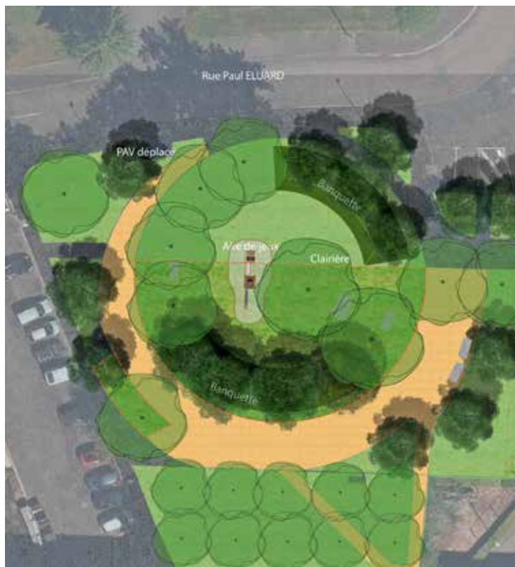
Le plan du square avec ses nouveaux arbres, ses espaces végétalisés et l'aire de jeux déplacée

La deuxième étape se déroulera au printemps : l'aire de jeux, enlevée en novembre, rejoindra son nouvel emplacement, au centre du square, à plus de 40 mètres de son emplacement initial, afin de limiter la gêne sonore pour les riverains. Les enfants (2-10 ans) découvriront des jeux répondant aux standards de sécurité actuels.