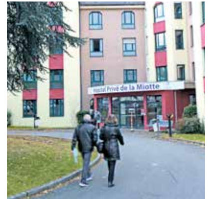
Un centre pour les petites urgences ouvrira ses portes fin janvier à la clinique de la Miotte