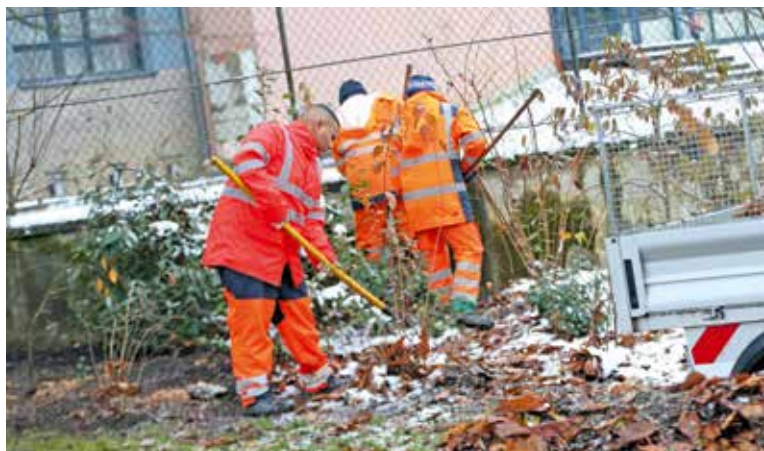
Les jeunes travaillent aux côtés des agents municipaux pour l'entretien des squares

de travail, explique Sylvie Montès, psychologue au CREA. Ils ont reçu un très bon accueil des équipes et se sont rapidement sentis à l'aise. Ils sont très fiers d'aller au travail, de recevoir des remarques positives, de voir qu'eux aussi ils peuvent s'inclure ».