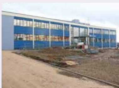
Une nouvelle façade et des abords réaménagés pour la piscine du Grand Belfort Gabriel-Pannoux

Le gymnase Pierre-de-Coubertin va être rénové du sol au plafond et agrandi