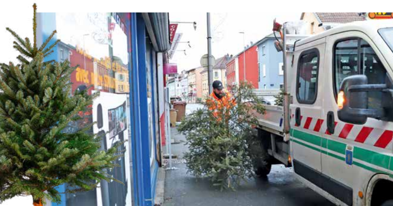
Les agents collectant vos sapins de Noël pour les transformer en broyat

Lorsqu'il n'est plus « mon beau sapin », l'arbre de Noël doit être jeté. Les services de la Ville de Belfort le ramassent gratuitement : deux dates sont fixées.