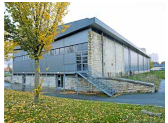
Le gymnase Pierre-de-Coubertin

Le gymnase va de plus être doté d'une extension qui accueillera des vestiaires pour le club de rugby l'Embar (coût du projet : 2 M€ HT).