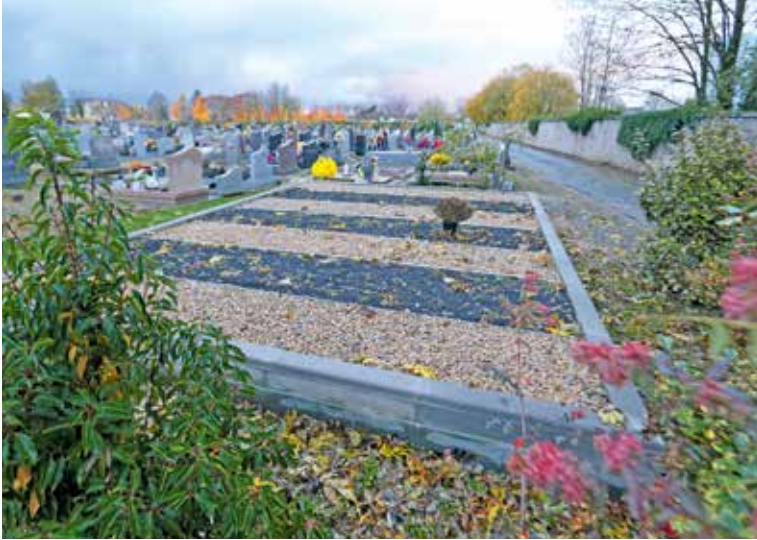
L'ossuaire de Bellevue, avec ses bandes de gravier blanc et ses plates-bandes plantées de sedums

Faire de nos cimetières des espaces plus naturels, moins minéraux, c'est l'objectif des travaux de végétalisation menés par la Ville de Belfort.