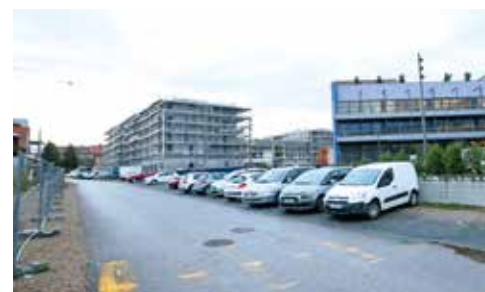
La rue Paulette-Guguenheim sera aménagée au second semestre 2024

Au quartier de l'ancien hôpital, 2024 verra notamment l'aménagement définitif de la rue Paulette-Guguenheim lorsque les projets immobiliers qui la jouxtent seront terminés.