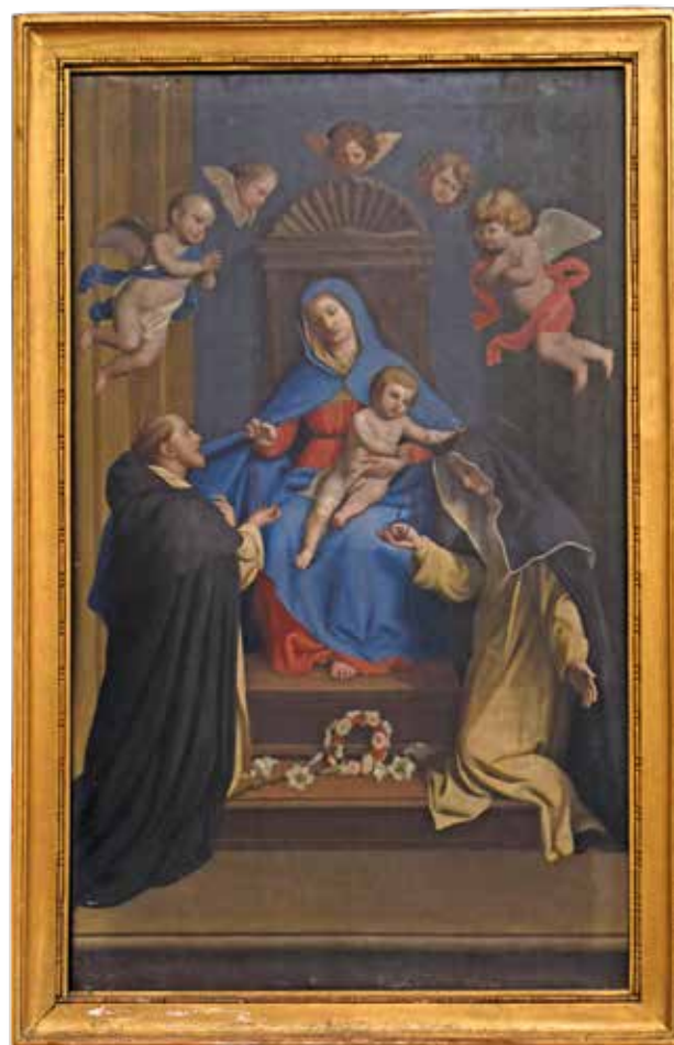
La Vierge à l'Enfant donnant le rosaire à sainte Catherine et saint Dominique