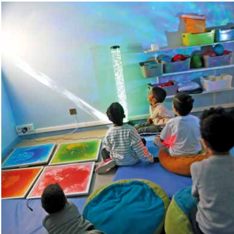
Un univers doux et coloré pour le bien-être des enfants dans l'espace multisensoriel de l'accueil périscolaire Louis-Aragon

Un nouvel espace multisensoriel a été aménagé à l'école maternelle Auguste-Bartholdi. Il s'ajoute à celui de l'accueil périscolaire Louis-Aragon, ouvert depuis la rentrée scolaire.