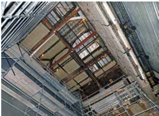
Le théâtre Granit en travaux, avec les anciennes installations enlevées

Au théâtre Granit, les installations scéniques sont en cours de modernisation, ce qui permettra de proposer aux Belfortains des spectacles qui ne pouvaient être accueillis auparavant (coût des travaux : 2,3 M€ HT). Les travaux prendront fin à l'automne 2024.