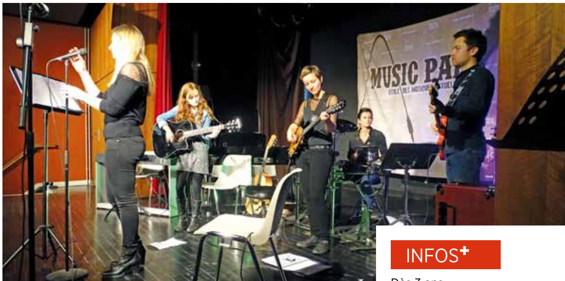
Les musiques actuelles au cœur de l'enseignement dispensé par Music Park 90