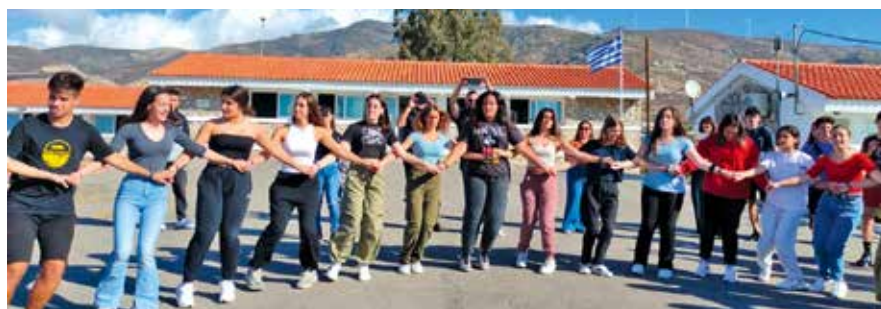
Les jeunes ont partagé leurs cultures par exemple avec les danses grecques

Visite d'Athènes, de Karystos (île d'Eubée), la ville de leurs correspondants grecs dont ils ont partagé le quotidien : les jeunes Belfortains sont revenus de leur séjour avec plein