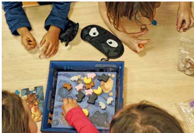
Une soixantaine de jeux sont proposés par la bibliothèque municipale