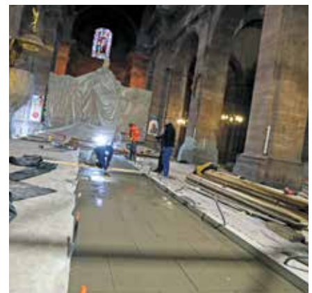
Des saignées sont creusées dans le sol pour accueillir le nouveau système de chauffage