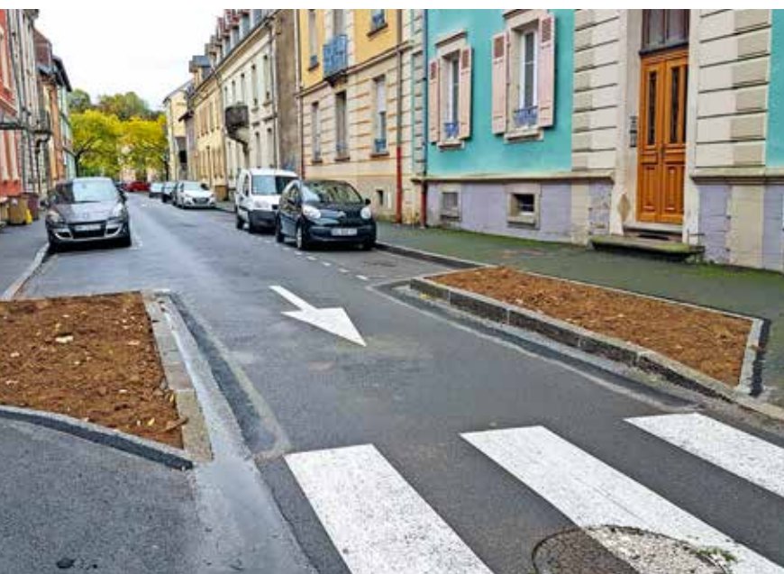
Un passage piétonnier sécurisé rue Auguste-Scheurer-Kestner

Renforcer la sécurité des piétons lorsqu'ils traversent la rue, c'est l'objectif d'un programme de travaux que la Ville de Belfort va mener jusqu'en 2026 pour rendre les passages piétonniers plus visibles.