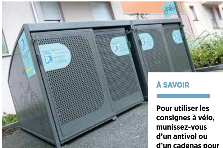
Des garages à vélo plus pratiques et plus durables

À raison de quatre places par site, les cyclistes belfortains disposent désormais de 24 places supplémentaires. Elles viennent s'ajouter aux douze premiers garages installés en 2019 près du théâtre Granit, du cinéma Kinopolis et rue de l'Ancien-Théâtre. Très utilisés, ils sont équipés de portes battantes qui parfois restent grandes ouvertes, gênant la circulation des piétons. De plus, leur bardage en bois s'est abîmé. Des défauts auxquels remédient les nouveaux garages.