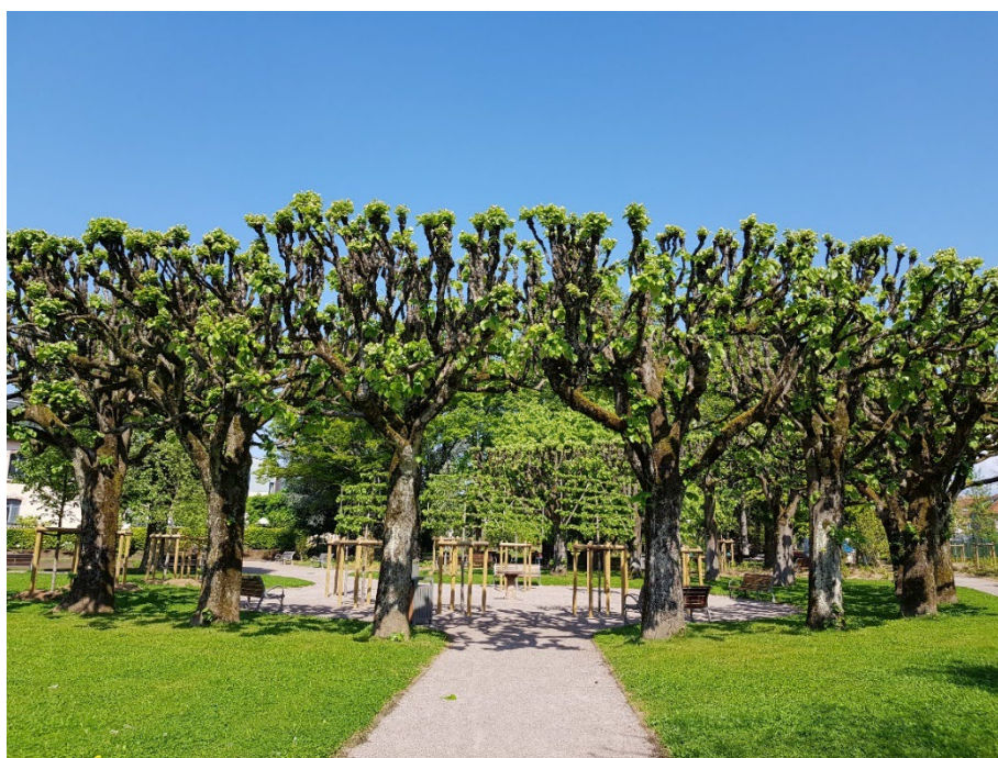
La rotonde et son double alignement de tilleuls