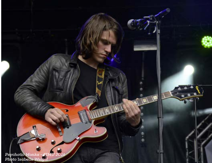
Psychotic Monks - FIMU 2016

Psychotic Monks, Last Train, Holy Two, Carbon Airways, La Féline, Prolet'R, Johnny Mafia, Scratchophone orchestra, Faso Combat, The Animen, Ariane Moffat, Awir Leon, Wallace Vanborn... autant de formations aujourd'hui repérées ou signées qui ont joué au FIMU à leurs débuts. Ils sont le témoignage que le FIMU est un festival défricheur qui met la programmation au cœur de son projet et permet à de nombreux groupes de se faire connaître du grand public et de se produire sur d'autres festivals.