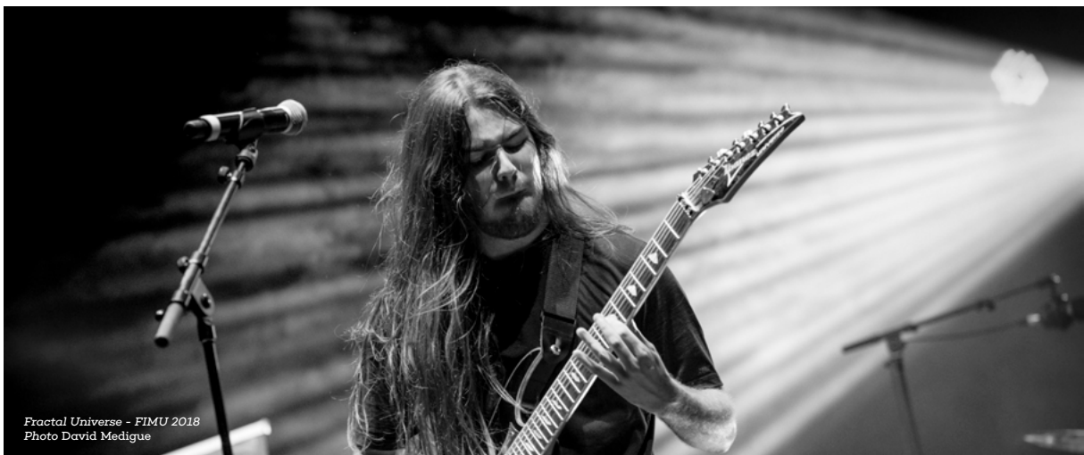
Fractal Universe - FIMU 2018

Comme chaque année, le FIMU lance son appel à candidature dans le monde entier par le relais des universités, conservatoires, écoles du musiques, ambassades, instituts et alliances françaises. Grâce à ces relais, ce sont plus de 1885 candidatures qui ont été enregistrées originaires de 87 pays différents. Un record !