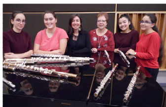
L'ensemble de flûtes traversières

Maison du Peuple place de la Résistance, à 20 h