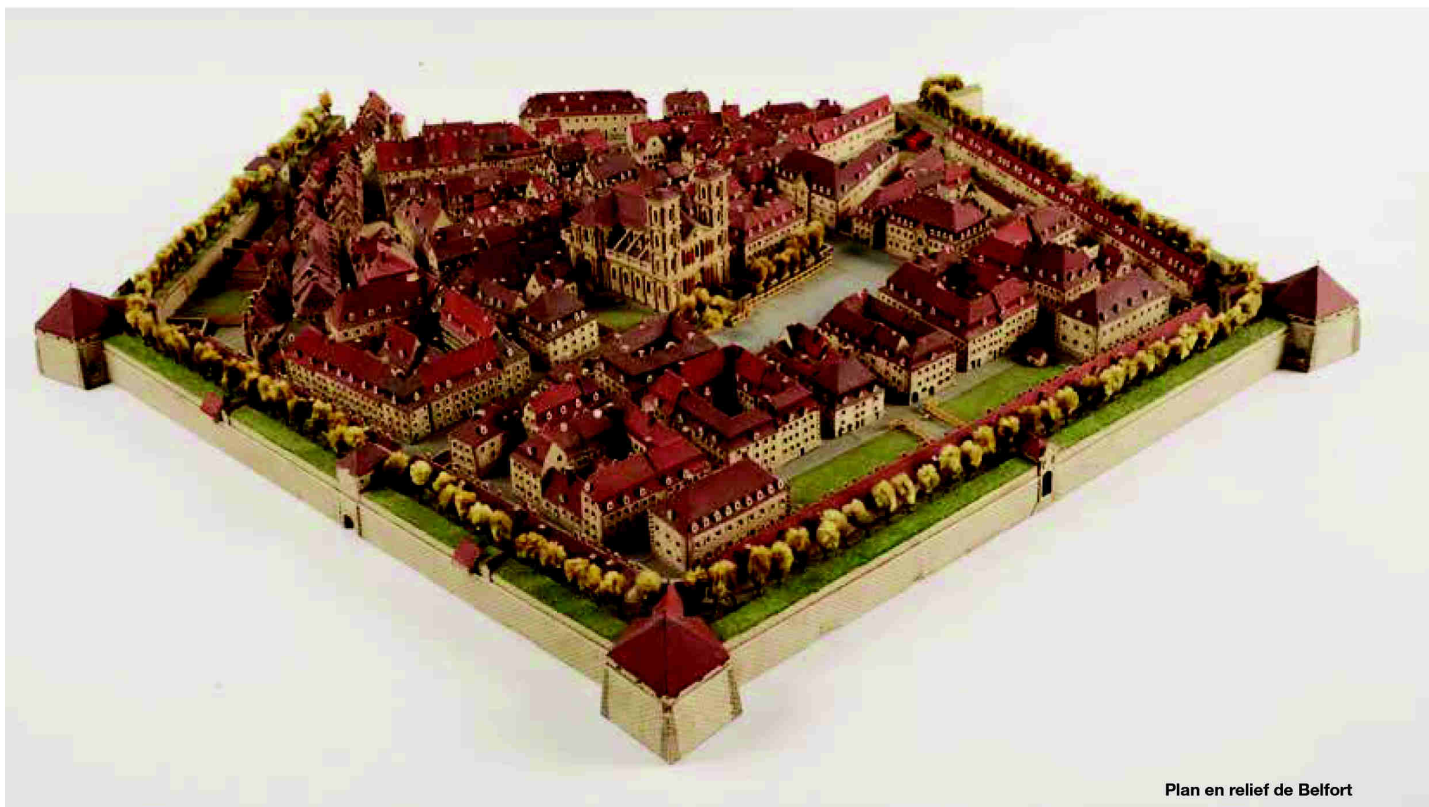
Plan en relief de Belfort

Belfort face à l'Allemagne. Belfort face aux Prussiens. Et le Lion de Belfort, place Denfert-Rochereau... C'est toute la mystique de la France républicaine après la défaite de 1870 qui s'exprime par le nom de cette ville. Elle a fait vibrer tous les patriotes de la Belle-Époque, c'est-à-dire à peu près la France entière, puisque les Français, toute opinion politique et classe sociale confondues, attendaient la revanche.