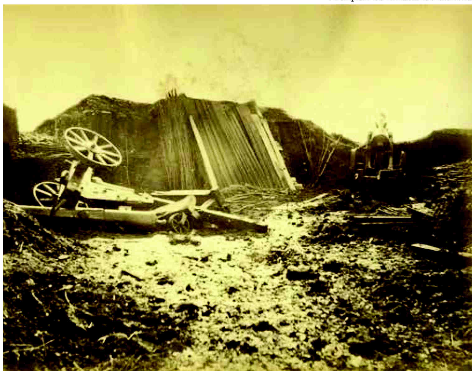
Ci-dessus : Batterie d'artillerie, photo Gerst et Schmidt / Ci-dessous : Une batterie de la citadelle