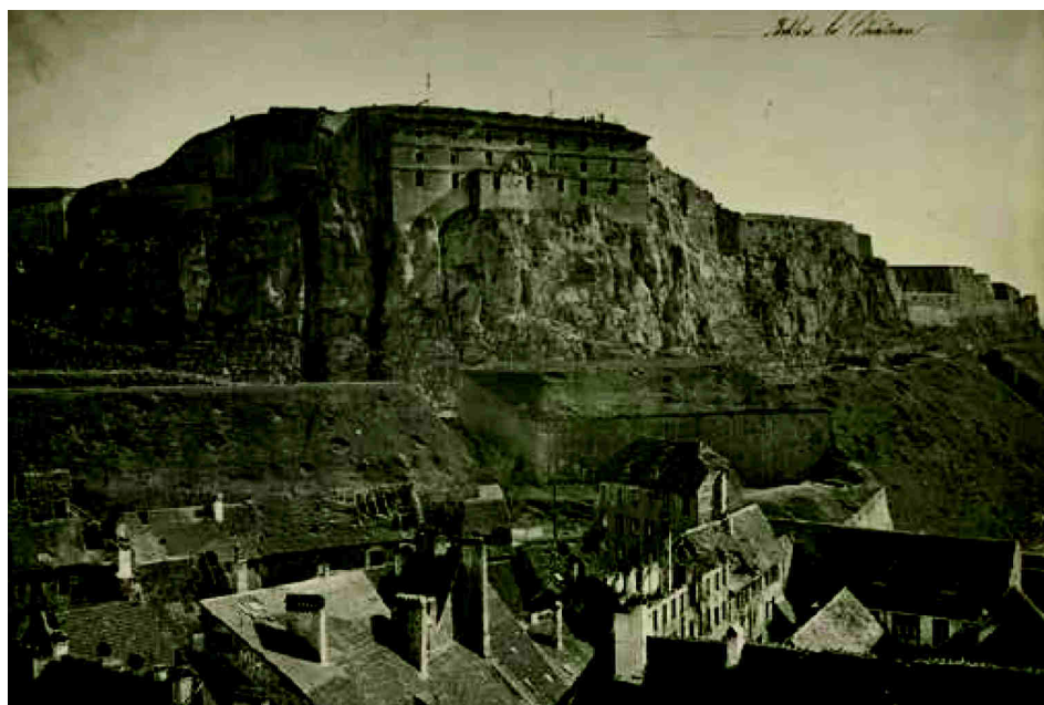
La façade de la Citadelle côté ville