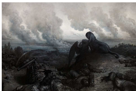
Gustave Doré L'énigme