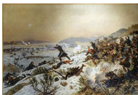
Alphonse de Neuville Attaque sur Chenebier

Durant le Festival d'Histoire vivante , un week-end sera programmé en août 2020 sur le siège de 1870-1871, avec un banquet et un bal républicains et la présence du Conservatoire Henri Dutilleux du Grand Belfort.