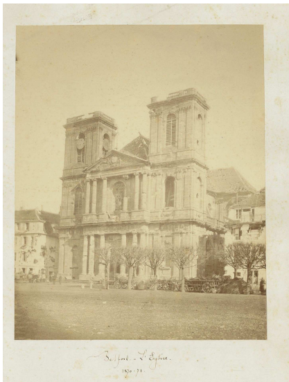
l'église Saint-Christophe pendant le siège de 1870-1871

La médaille du siège a été décernée en 1910. Les 110 ans de cette médaille seront commémorés en 2020.