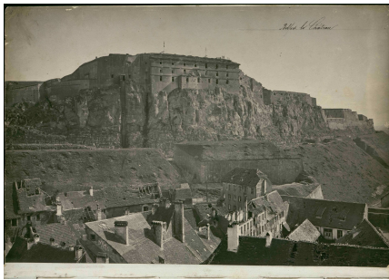
les dégâts du siège à Belfort, photos Braun, 1871

- des photographies Gerst et Schmidt documentant la ville au cours de la période qui suit sa reddition. L'essentiel du fonds est conservé aux Musées de Belfort. Les archives municipales en possèdent également;